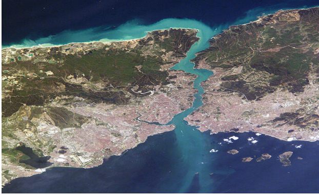
Şekil 1: İstanbul Boğazı'nın Uydu'dan Görünümü

Karadeniz ve Akdeniz seviye ve tuz bakımından farklı olduğu için söz konusu iki deniz arasında İstanbul Boğazı'nda birbirlerine ters yönde ilerleyen yüzey ve dip akıntıları olmak üzere altlı üstlü iki tabakalı akıntı sisteminin olduğu görülmekte olup zaman zaman hızı saatte 7-8 knota (1 knot saatte 1 mil yol) ulaşmaktadır. Yüzey akıntıları Boğazın orta çizgisini izler, ana akıntı burunlara çarparak ve koylara girerek anaför oluştururlar. İstanbul Boğazı'nda az tuzlu ve yoğun olmayan yüzey suları, Karadeniz'den İstanbul Boğazı, Marmara Denizi ve Çanakkale Boğazı yolunu takip ederek, Ege Denizi'ne doğru akar; çok tuzlu, yoğun ve deniz yüzeyinin 10 m. altında bulunan dip suları, tam ters yönde Karadeniz'e doğru ilerler. Akıntı üstten Çanakkale'ye, alttan Karadeniz'e doğru akar (Gültepe, 1998: 8-46). Dip akıntısının sürati Marmara Denizi'nden Boğaza girişte yaklaşık 1 knot iken, Karadeniz çıkışında yaklaşık 2 knot'dır (Güler ve Poyraz, 1997: 535-541). İstanbul Boğazı'nda Karadeniz'den Marmara'ya doğru olan yüzey akıntısı şiddeti lodos rüzgarlarında Marmara'dan Karadeniz'e doğru dönebilmekte olup bu akıntıya orkoz adı verilmektedir. İstanbul Boğazı'nda yıl boyunca hakim rüzgar Kuzey Kuzey Doğu (Nort-North-East (NNE)) ve Kuzey olup en şiddetli estikleri zaman Sonbahar ve kış aylarıdır (Çetin, 1999: 6).