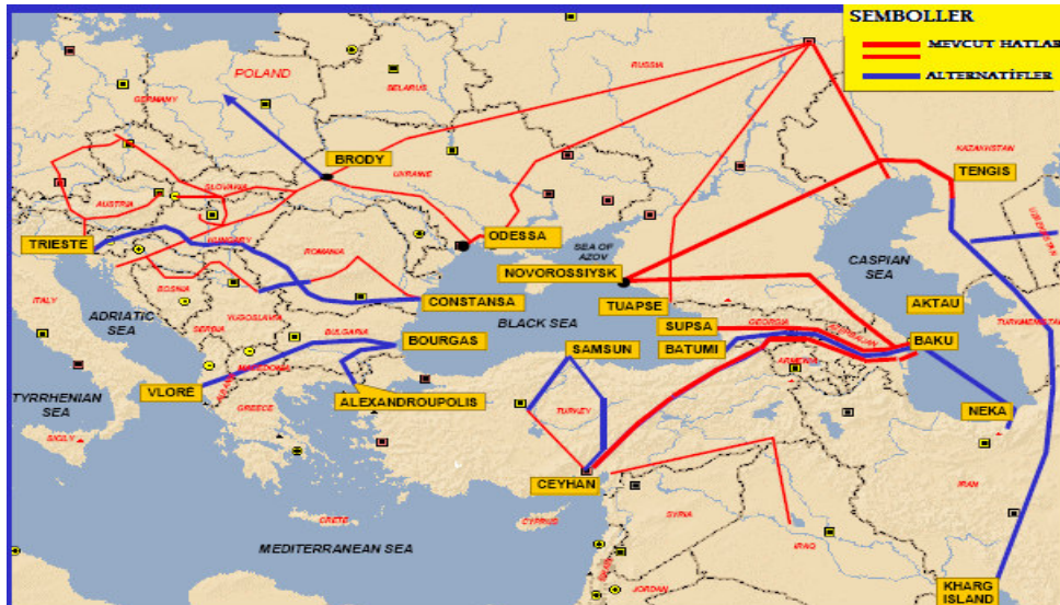
Şekil 3. Türk Boğazlarına alternatif boru hatlarından bazıları

İstanbul ve Çanakkale Boğazları'ndaki gerek yoğun uluslararası trafik, gerek iki kıyı arasındaki yerel trafik ve gerekse Boğazlardaki oşinoğrafik, meteorolojik ve coğrafik kısıtlar, Hazar petrolünün bu rotadan uluslararası piyasaya çıkışını zorlamaktadır. Bu sebeple Boğazlara alternatif olabilecek ve bölge petrolünü uluslar arası pazara ulaştıracak transit boru hattı projeleri üzerinde çalışılmaktadır. Bazı alternatif projeler Şekil-3'te verilmiştir.