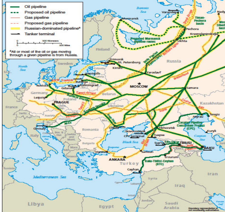
Şekil 1. Hazar Petrollerinin ana Güzergahları

ihracatında Rusya'ya bağımlılığı azaltacak alternatif boru hattı projelerine eğilimlerdir. Özellikle 1990 yılından sonra bir çok boru hattı inşa edilmiştir. Bölgeye ait boru hatlarının haritası Şekil-1'de verilmiştir.