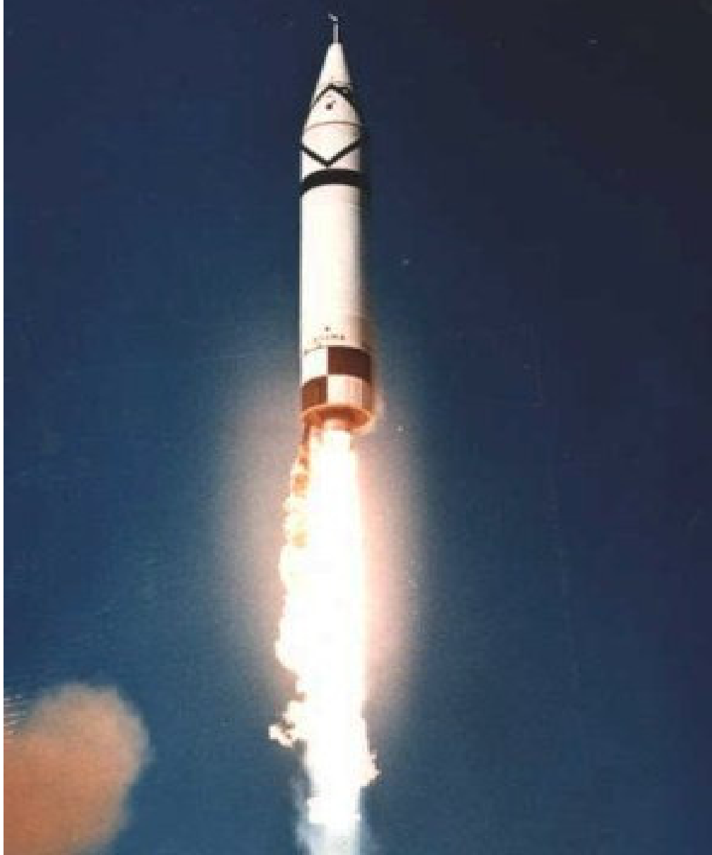
SSCB'nin Küba'ya yerleřtirdiđi onlarca Orta Menzilli Nükleer Füzeđen bir tanesi 4 .