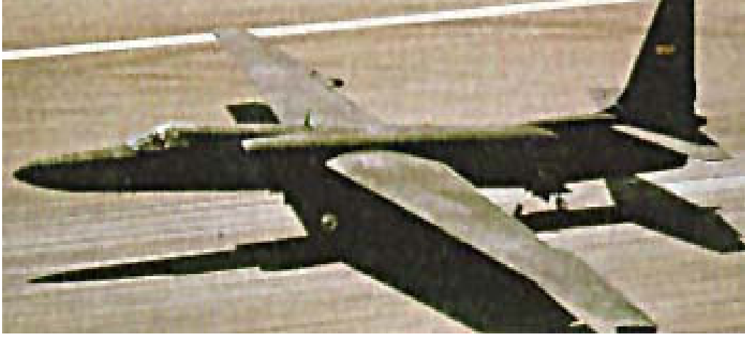
ABD'nin soğuk savaş süresince SSCB'ye karşı çok sık başvurduğu keşif uçağı U-2 5 .