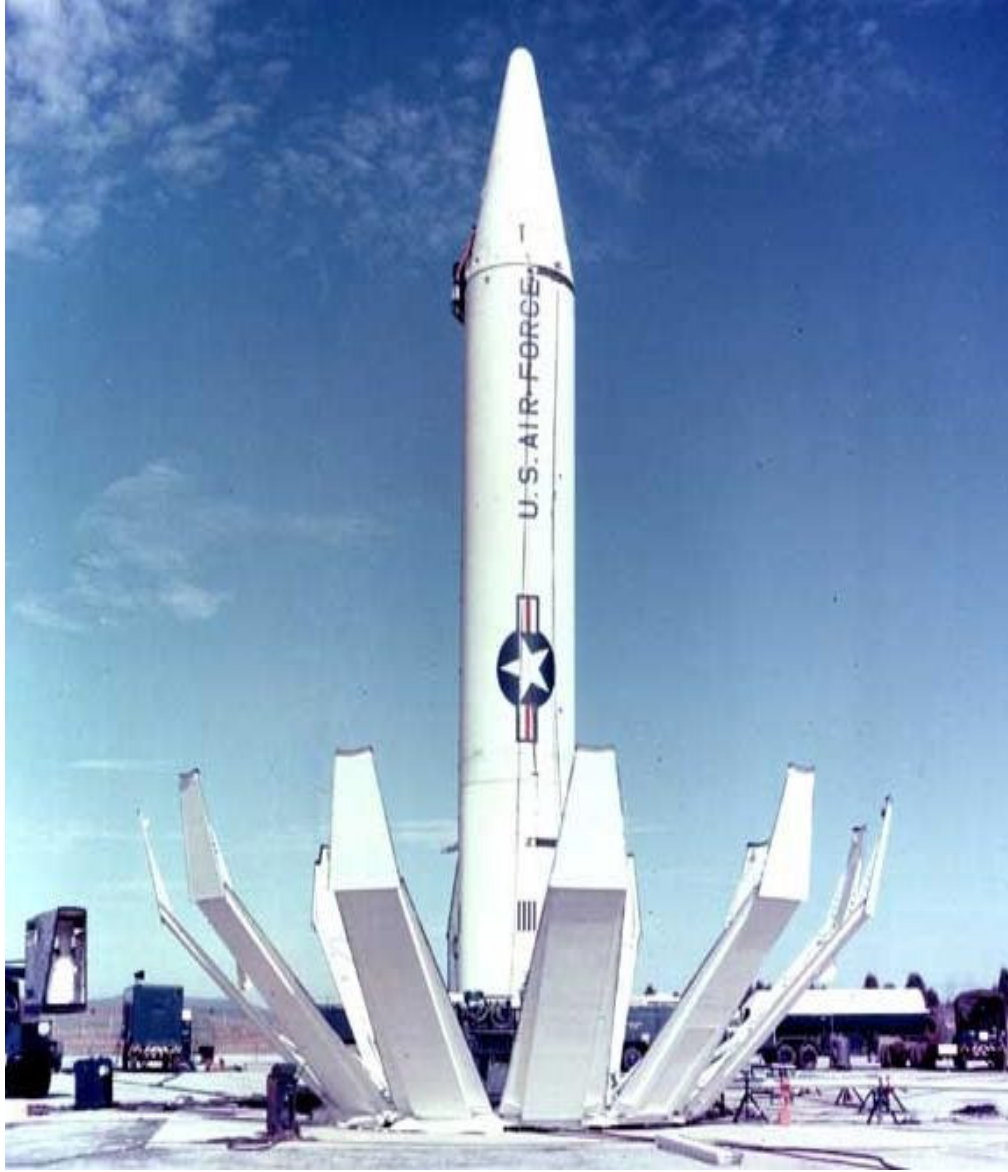
Soğuk savaş sırasında 1957'de Türkiye'ye konuşlandırılması planlanan ve 1962'de yerleştirilen ardından 1963'te sökülen Orta Menzilli Balistik Füze, JÜPİTER. 3