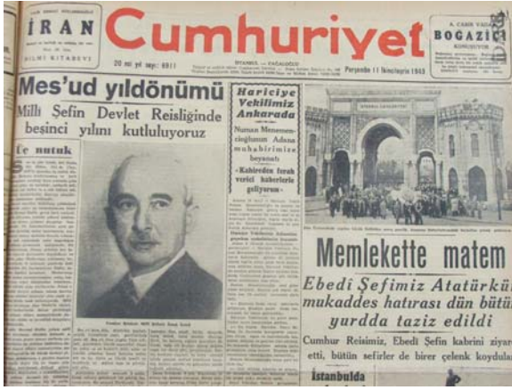
11 Kasım 1943

ön plana çıkarma yarışına girdiğine, Türk Milleti'ne kendisinin Atatürk'ten sonra bir vazgeçilmez, en az Atatürk kadar büyük bir lider olarak algılatmak istediğine somut kanıt olarak gösterilebilir. Başka bir deyişle İnönü, "İkinci Bir Atatürk" olmak istemiştir.