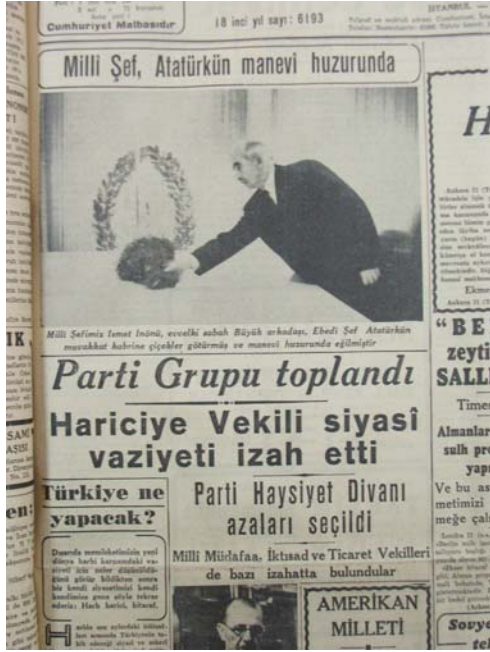
12 Kasım 1941