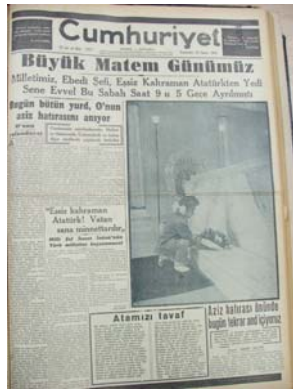
10 Kasım 1945