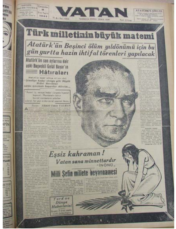
10 Kasım 1943