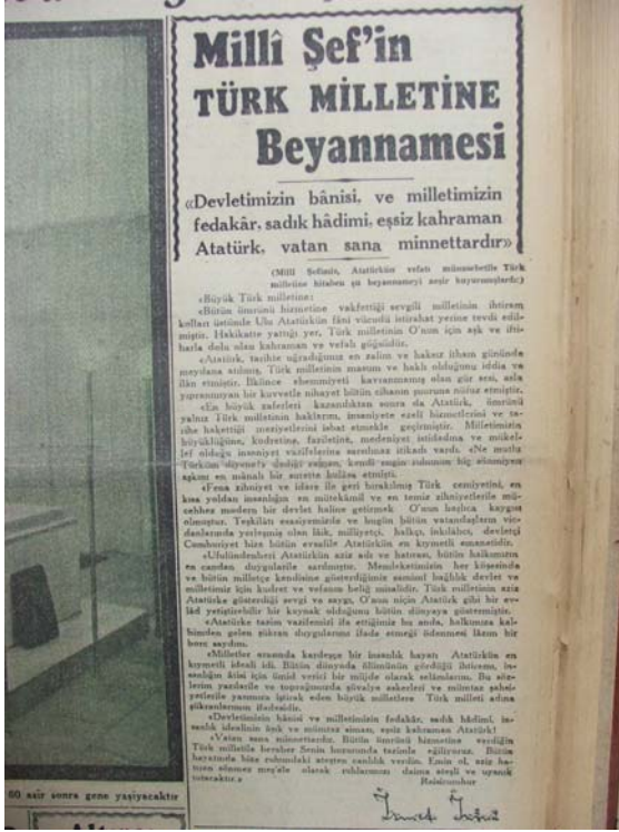
10 Kasım 1944