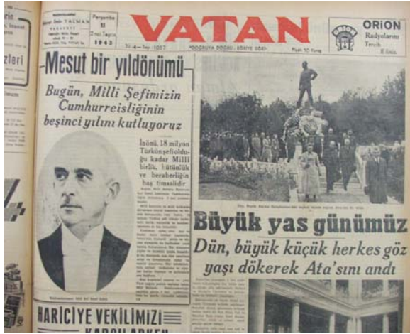
11 Kasım 1943