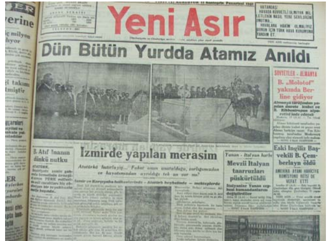
12 Kasım 1940