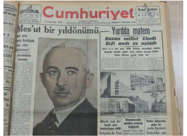
12 Kasım 1940