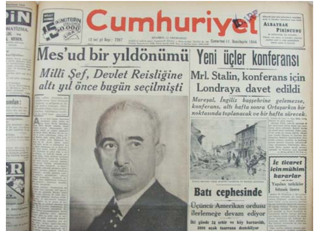
11 Kasım 1944