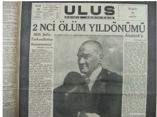
10 Kasım 1940