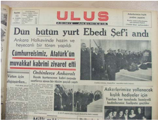
11 Kasım 1940