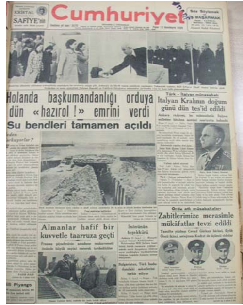
12 Kasım 1939