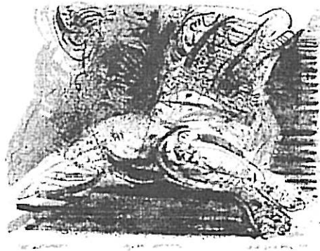
Resim 4: Mehmet ÖZER

ADAMAK (Dedication): Bir baskı bazen bir arkadaşına ya da bir başkasına adanabilir (hediye edilebilir). Bu durumda sanatçı isminden sonra ".....için" (for.....) şeklinde ifade kullanır. Bunlar için çoğu kez numaralı baskılardan biri seçilir.