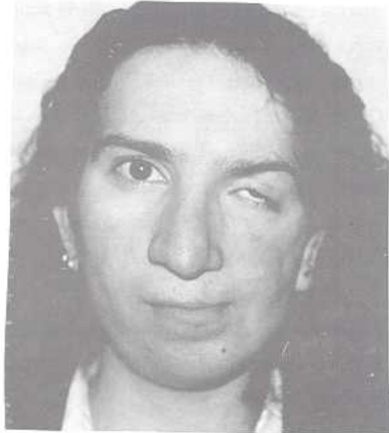
Şekil 3b: Poröz polietilen ile mandibula augmentasyonu, postoperatif görünüm