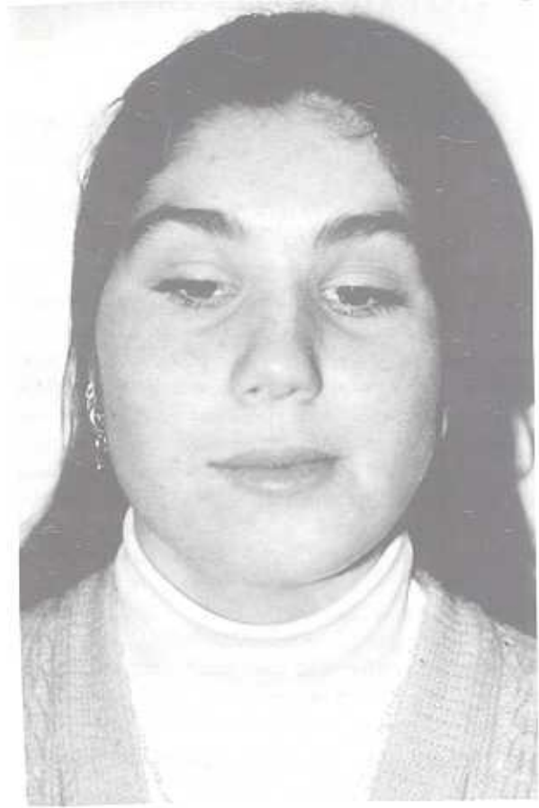
Şekil 1b: Silikon blok ile mandibula augmentasyonu, postoperatif görünüm