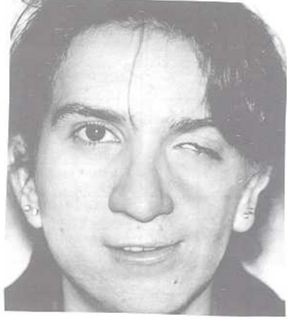
Şekil 3a: Sol hemifasiyal mikrozomi, preoperatif görünüm

mandibula kontur düzeltme operasyonu uygulanmış, böylece fonksiyonel iyileşmenin ardından ruhsal iyileşme de elde edilmiştir.