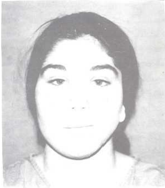
Şekil 1a: Sol hemifasiyal mikrozomi, preoperatif görünüm

1991-1997 Yılları arasında kliniğimize başvuran 13 hastaya yüzde asimetri tanısı konulmuş, yapılan araştırmalarda doğumsal ya da gelişimsel nedenlerle bir yüz yarısında ya da yüzün bir bölgesinde kemik ve yumuşak doku defekti olduğu saptanmıştır. Hastalara değişik semetik materyaller ile yüz kontur restorasyonu uygulanmıştır (Şekil 1a, 1b, 2a, 2b, 3a, 3b). Olguların etiyojisi, kullanılan materyal ve metod Tablo 1' de verilmiştir.