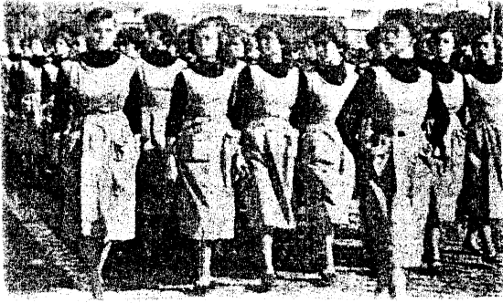
(Ege Ekspres, 30 Kasım 1955)

İkinci Kordon'daki Cumhuriyet Kız Enstitüsü İzmir'in eski okullarındandır. Bu okulda biçki, dikiş, nakış, çiçek yapımı, mutfak, moda ev yönetimi gibi bölümler bulunmaktadır. Günde 8 saat derse rağmen öğrenciler sporda da oldukça başarılıdır. Okul, özellikle atletizm dalında şampiyonluğu düzenli olarak elinde tutmaktadır [9]. Cumhuriyet Kız Sanat Enstitüsü'nde üç tip öğrenci okumaktadır. Bunlar erkek sanat enstitülerinde de olduğu gibi genel bölüm öğrencileri, özel bölüm öğrencileri ve akşam okulu öğrencileridir. Okulda en kalabalık bölümü akşam öğrencileri oluşturmaktadır Akşam öğrencilerinde bir yaş sınırlaması bulunmamakta ve bu bölümdeki öğrenciler genelde moda, çiçekçilik ve çamaşır derslerine ilgi göstermektedirler [10].