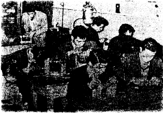
(Ege Ekspres, 19 Ocak 1956)

Mithatpaşa Erkek Sanat Enstitüsü 1950'li yıllarda İzmir kent merkezindeki tek erkek sanat enstitüsü olduğundan zamanla kentin gereksinimini karşılayamaz duruma gelmiştir. Öğrenci sayısının giderek artması, atölyelerde sıkışıklık yaşanmasına neden olmuştur. Bu durum da okulun eğitimindeki verimliliği düşürmeye başlamıştır [8].