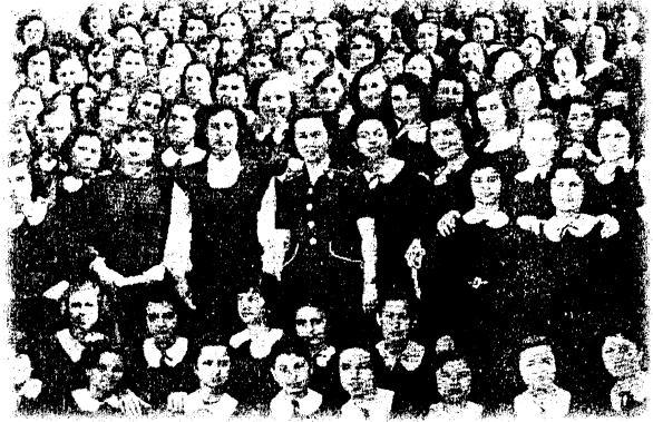
(Demokrat İzmir, 18 Mayıs 1952)

İzmir'in ikinci büyük kız enstitüsü olan Göztepe Kız Sanat Enstitüsü'nün binası önceleri bir Ortodoks kilisesidir. Bu binada 1923 yılında Sepet-Çiçek Enstitüsü açılmıştır [11]. 1942 yılında okulun bir bölümü bugünkü Cumhuriyet Kız Enstitüsü binasına taşınırken, bir bölümü de akşam sanat okulu olarak Göztepe'de kalmıştır. Bir süre Göztepe'de akşam sanat okulu olarak hizmet veren okul, İzmir'de kız enstitüsüne gereksinim duyulması üzerine 1947 -1948 yılında Göztepe Kız Enstitüsü adını almıştır [12].