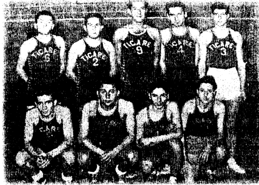
(Ege Ekspres, 2 Mart 1956)