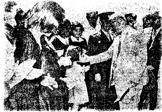
(Demokrat İzmir, 2 Mayıs 1952)

Köy enstitülerinin öğretmen okullarına dönüştürülmesi projesi nedeniyle, köy enstitüleri uygulaması genel olarak 1954 yılında son bulmuştur. Ancak Kızılçullu Köy Enstitüsü NATO'nun karargâh merkezinin İzmir olması ve karargâh yeri olarak da Kızılçullu Köy Enstitüsü'nün yerinin seçilmesi üzerine, 1952 yılında öğretmen okuluna dönüştürülemeden kapanmış ve öğrencileri farklı kentlere gönderilmiştir. Böylece bir zamanlar Amerikan Erkek Koleji'nin arazisi olan Kızılçullu, yeniden yabancıların eline geçmiştir. Kızılçullu Köy Enstitüsü'nün 1952 yılında kapanmasından sonra artık İzmir'de öğretmen yetiştiren bir kurum kalmamıştır. İzmir'in bu alandaki eksiği ancak 1959 yılında, bugün Buca Eğitim Fakültesi olarak adlandırılan, Buca Eğitim Enstitüsü'nün açılmasıyla giderilebilmiştir.