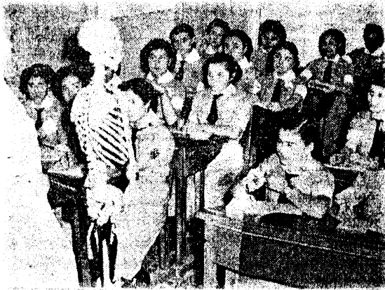
(Yeni Asır, 5 Nisan 1953)

İzmir’de güzel sanatlar alanında, 1954 yılında eğitim vermeye başlayan Müzik Okulu vardır [32]. Diğer okullarda normal öğrenimini sürdüren öğrenciler bu okulda yalnızca müzik