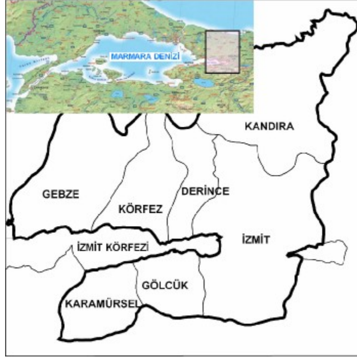
Şekil 1. Kocaeli ili haritası

Nüfus değerleri T.C. Başbakanlık Devlet İstatistik Enstitüsü'nün 2000 yılı nüfus sayımı sonuçlarına dayanan istatistiklerden temin edilmiştir. Yakıt tüketimlerinin belirlenmesinde İl Çevre ve Orman Müdürlüğü ile Belediyelerden temin edilen bilgiler kullanılmıştır. Belirlenen yıllık yakıt tüketim miktarları ile emisyon faktörlerinin çarpılması sonucu toplam emisyon miktarı hesaplanmıştır. Çalışmada kullanılan EPA emisyon faktörleri ve emisyon faktör sınıfları Çizelge 2'de verilmiştir. Emisyon faktör sınıfı; güvenilirliğin belirtisidir. Bu oran, faktörün geliştirilmesi için kullanılan testlerin güvenilirliğinin tahminine bağlı olarak verilmektedir. Bu sınıf A'dan E'ye kadar değişmektedir. Faktörler, birçok gözleme ya da kabul görmüş test prosedürlerine göre belirleniyorsa A sınıfı, buna karşılık benzer prosesler için diğer faktörlerden tahmin ediliyor ya da tek bir gözleme bağlı olarak belirleniyorsa D ve E sınıfı olmaktadır.