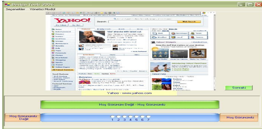
Şekil 2. Web Portallarının Kullanıcılarda Uyandırdığı Profesyonellik Hissini Ölçmek İçin Geliştirilmiş Ara Yüz

Çalışmamızda, Web portallarının kullanıcılarda uyandırdığı profesyonellik hissini ölçmek için bir anket geliştirilmiştir. Verilerin elde edilmesi aşamasındaki zaman ve veri kaybının önlenmesi amacıyla C# programlama dili kullanılarak Şekil 2'de gösterilen ara yüz tasarlanmıştır.