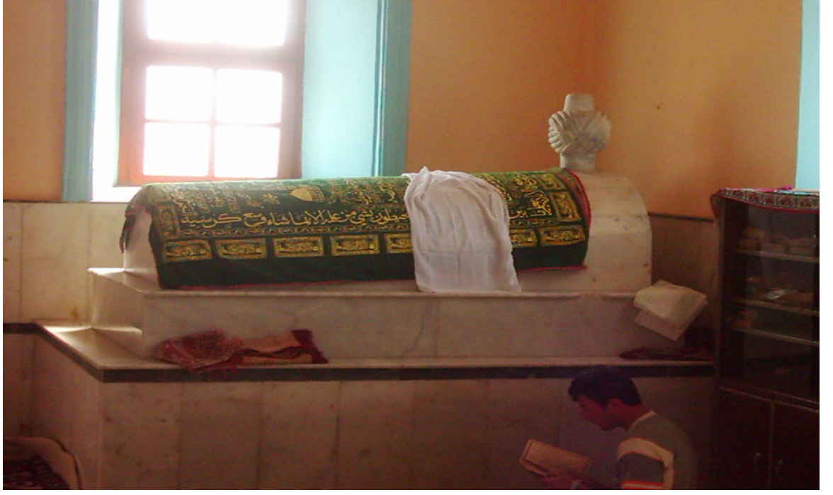
Şekil. 1 Abdülkadir Geylâni Sâni Türbesi