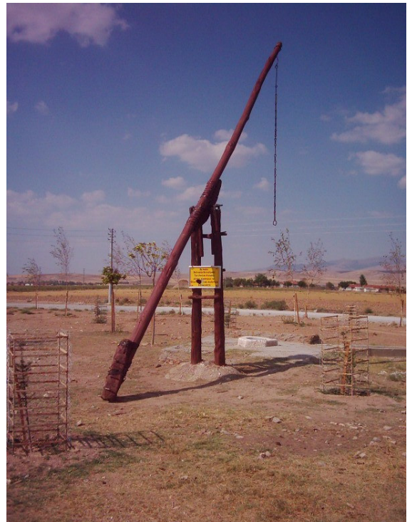
Şekil. 7 Abdülvahap Gazi Türbesi'nin Karşısındaki Kuyu