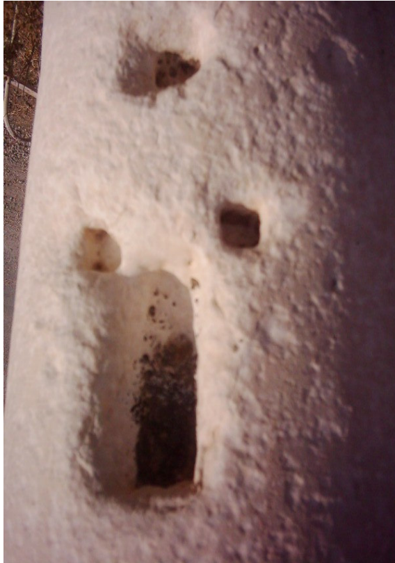
Şekil. 27 Sütun Üzerinde Bulunan Para Kovukları