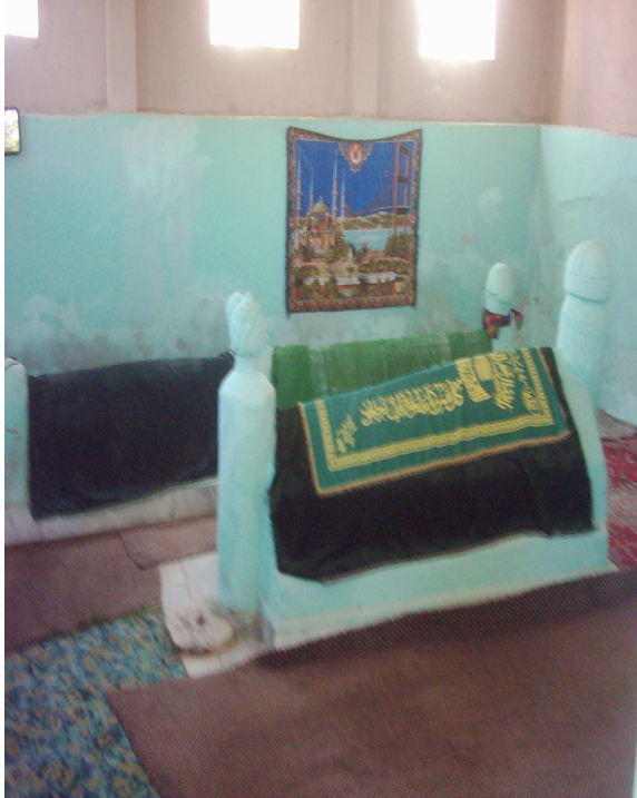
Şekil.12 Sultan Carullah Türbesi'ndeki Sandukalar