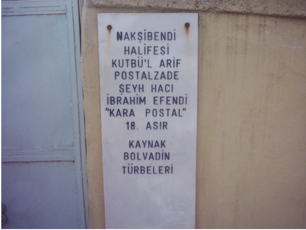
Şekil. 21 Postal Zade Şeyh Hacı İbrahim Efendi Türbesi'nin Tabelası