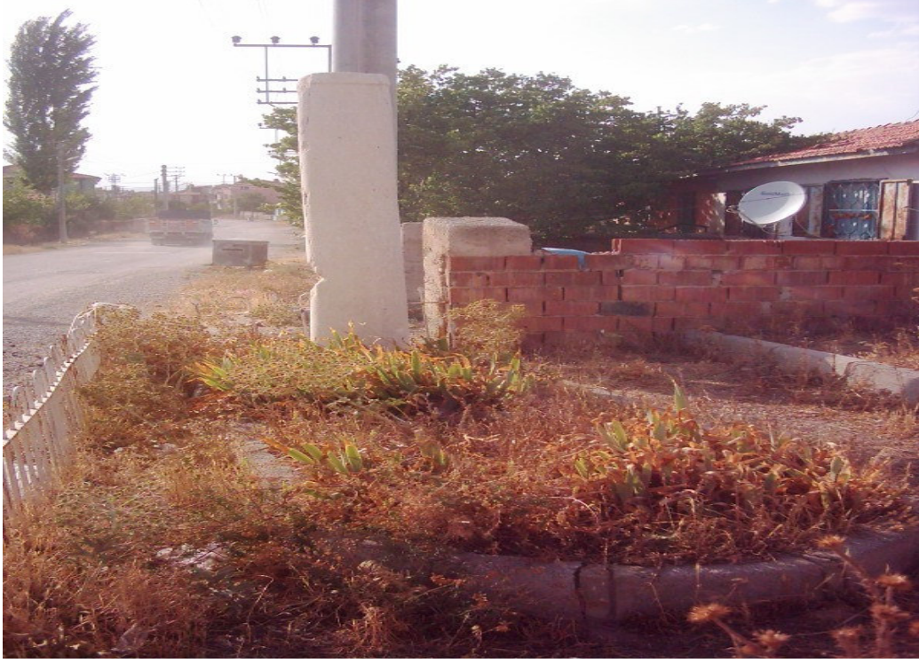
Şekil. 26 Müslüman Ana Mezarı ve Başındaki Sütun