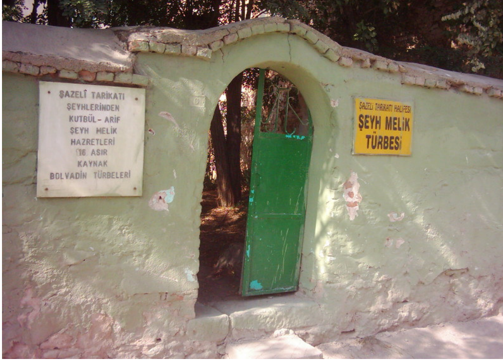
Şekil.16 Şeyh Melik Türbesi