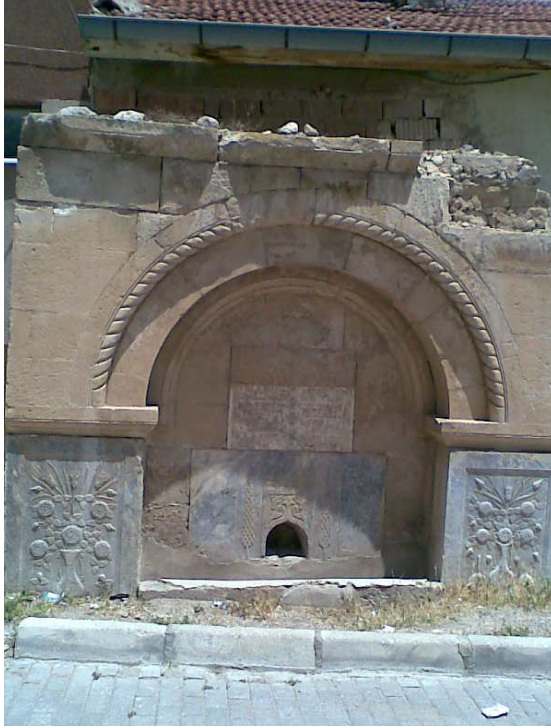
Şekil.2 Türbe Karşısındaki Çeşme