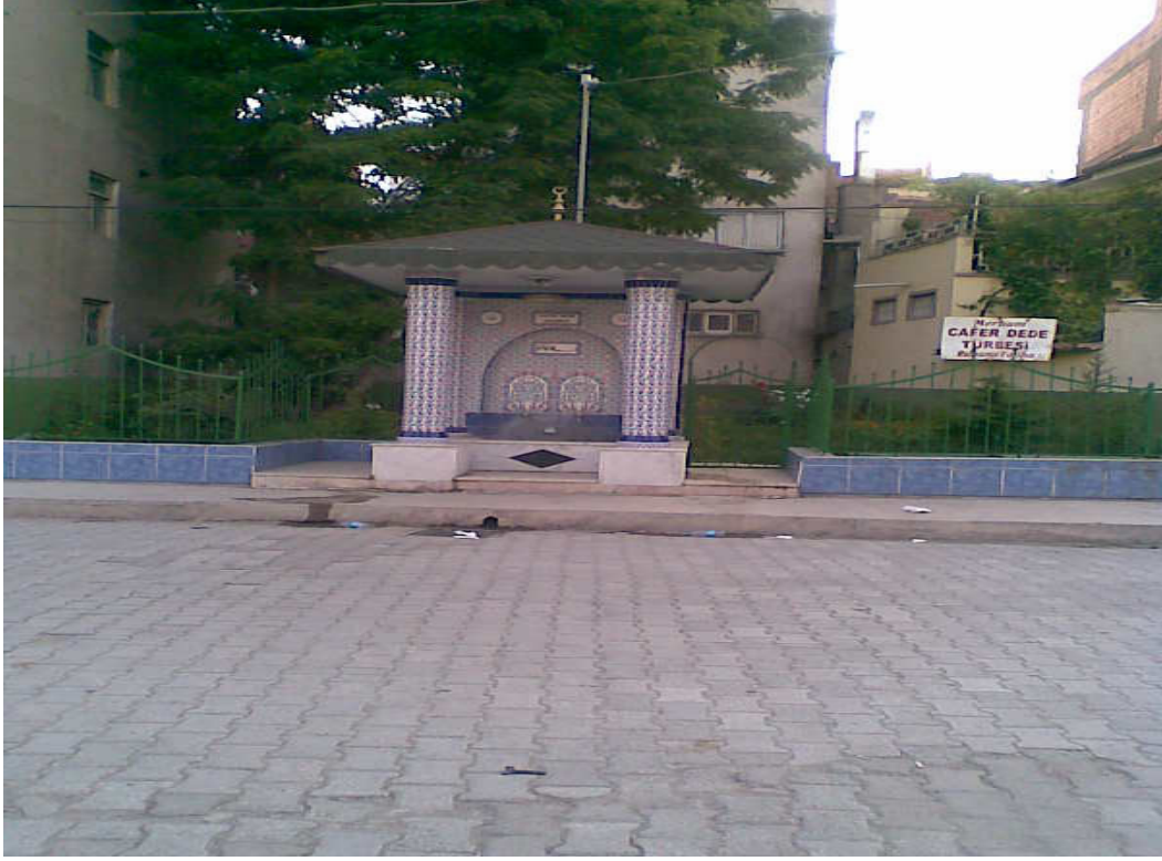
Şekil. 23 Cafer Dede Türbesi