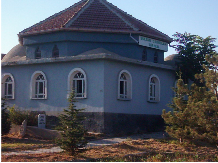
Şekil. 11 Sultan Carullah Türbesi