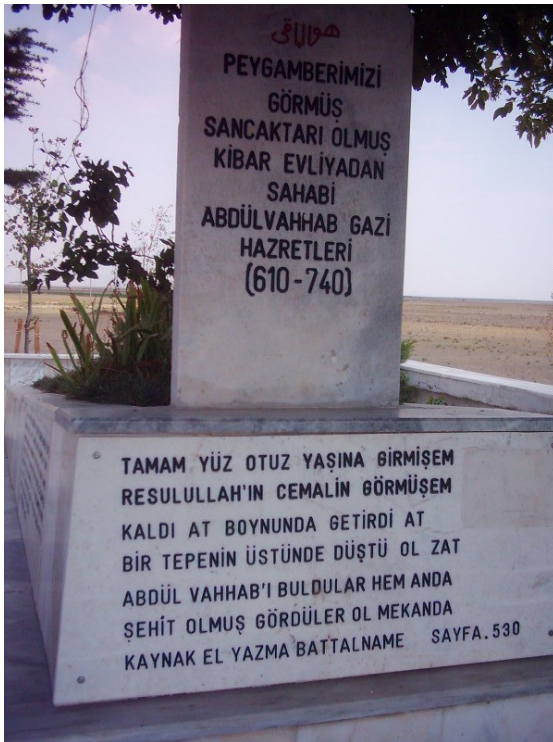
Şekil. 6 Abdülvahap Gazi Türbesi'nin Mezar Taşı