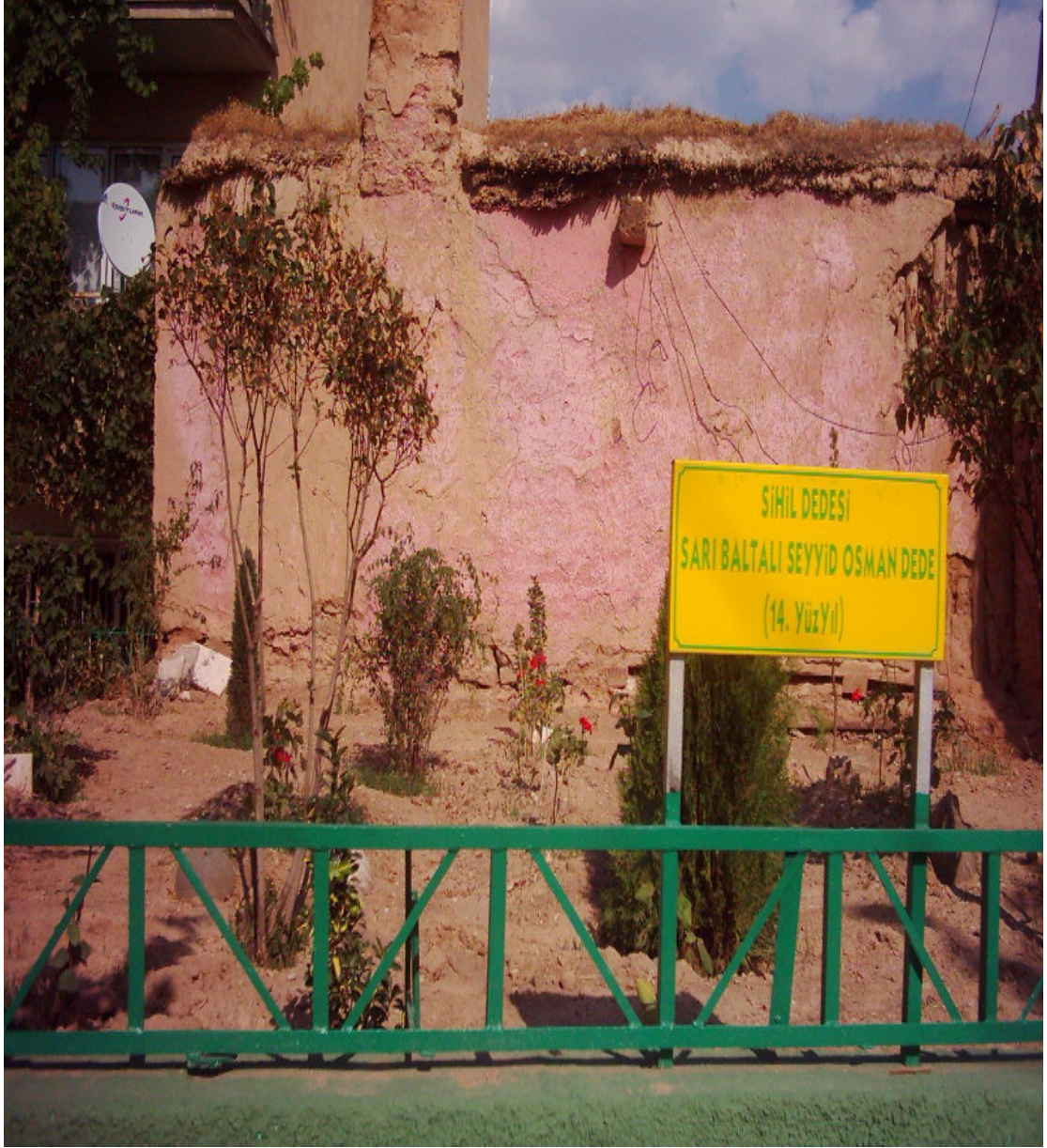
Şekil. 25 Sarı Baltalı Seyyid Osman Dede ( Siğil Tekkesi)