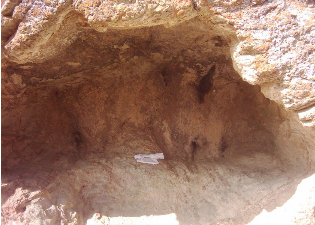
Şekil. 29 Kaya Mezarı İçindeki Çocuk Çamaşırı