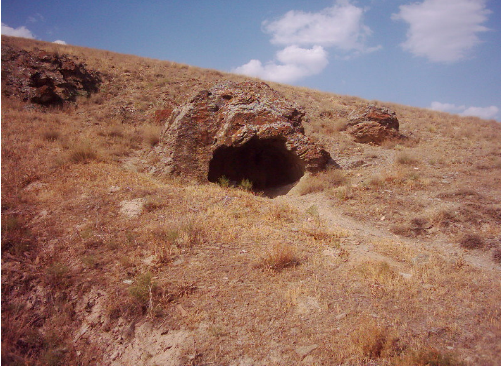
Şekil. 28 Kızlar Evcığı (Kırk Kızlar)