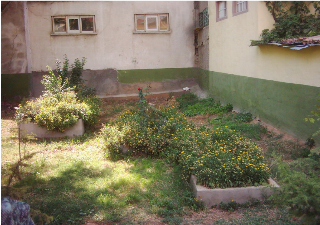
Şekil. 24 Cafer Dede Türbesi' nin İçi