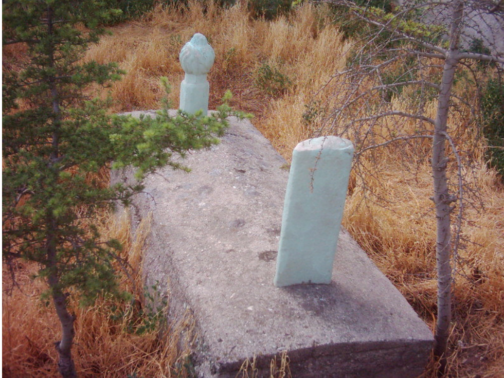
Şekil. 22 Postal Zade Şeyh Hacı İbrahim Efendi Türbesi'nin İçi