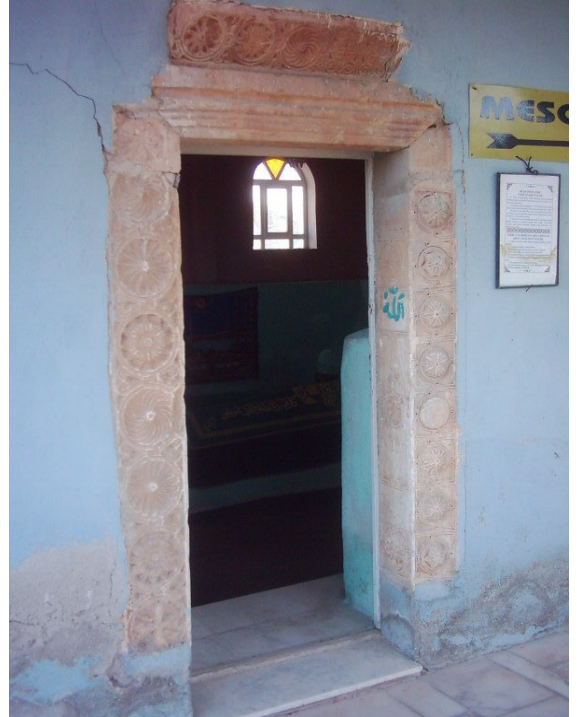
Şekil. 13 Sultan Carullah Türbesi'nin Kapısı