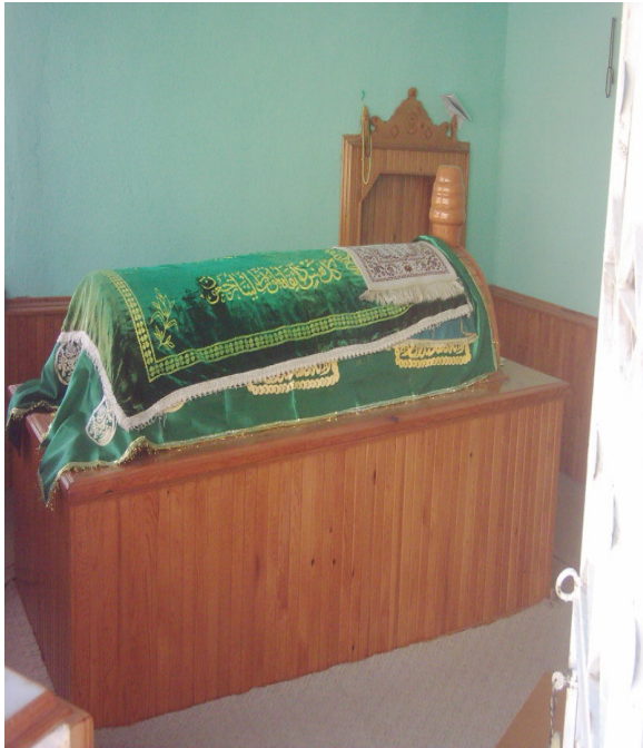
Şekil. 9 Seyyid Ahmet Halil Paşa Türbesi'nin içi