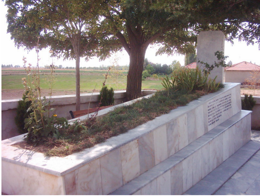
Şekil. 5 Abdülvahap Gazi Türbesi