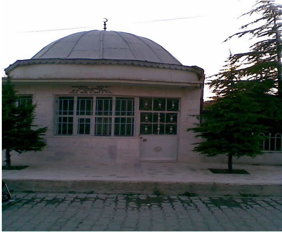
Şekil. 8 Seyyid Ahmet Halil Paşa Türbesi