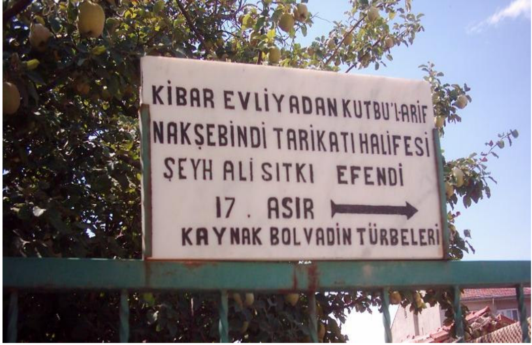
Şekil. 18 Ali Sıtkı Efendi Türbesi