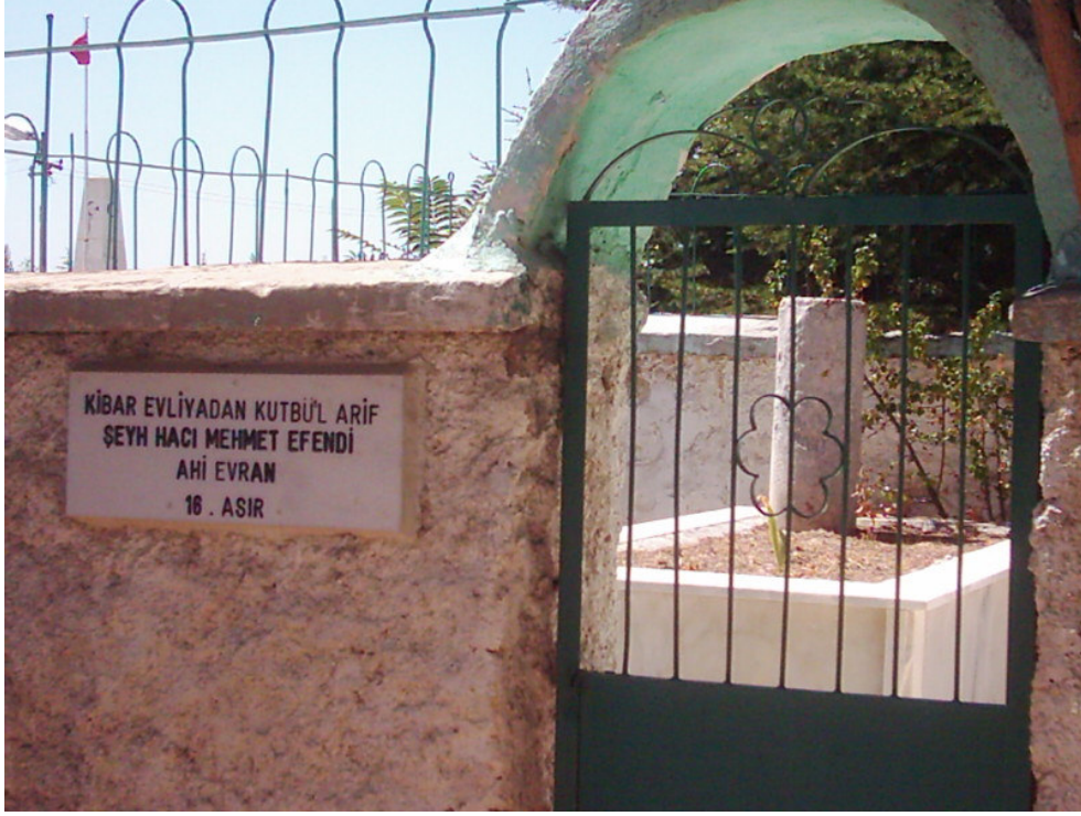
Şekil. 14 Ahi Evran Mehmet Efendi Türbesi (Üstü Açık)