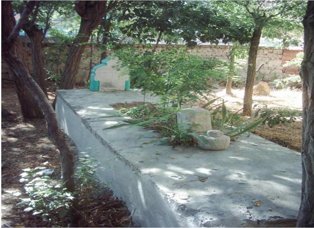
Şekil.17 Şeyh Melik Türbesi'nin İçi