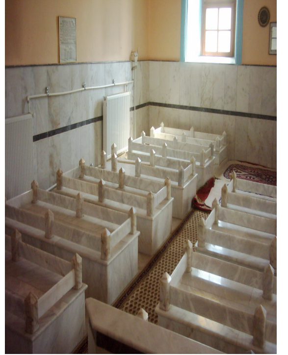
Şekil. 3 Türbe İçindeki Sandukalar