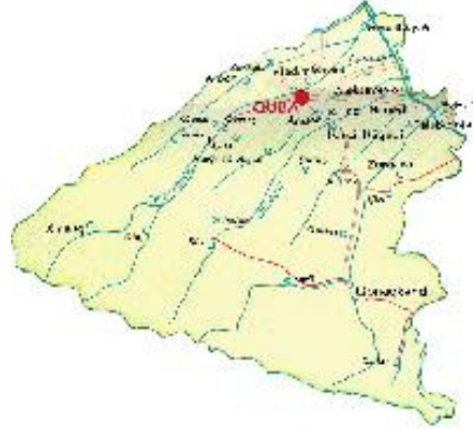
Şekil 2.6.: Guba Rayonunun Haritası