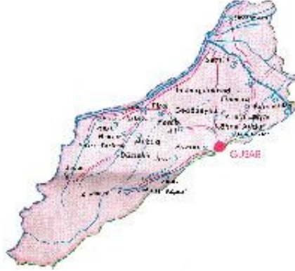
Şekil 2.7.: Gusar Rayonunun Haritası

Kaynak: Azərbaycan Respublikası İqtisadi İnkişaf Nazirliyi, Quba – Xaçmaz İqtisadi Rayonu Üzrə Regional Şöbə, Erişim: 03.05.2009., http://regionaldepartment.info/new/qubxacmaz/