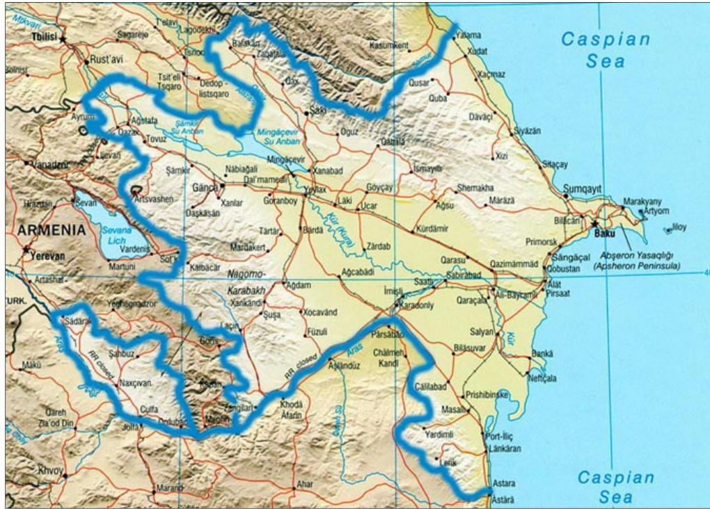
Şekil 2.1.: Azerbaycan Haritası