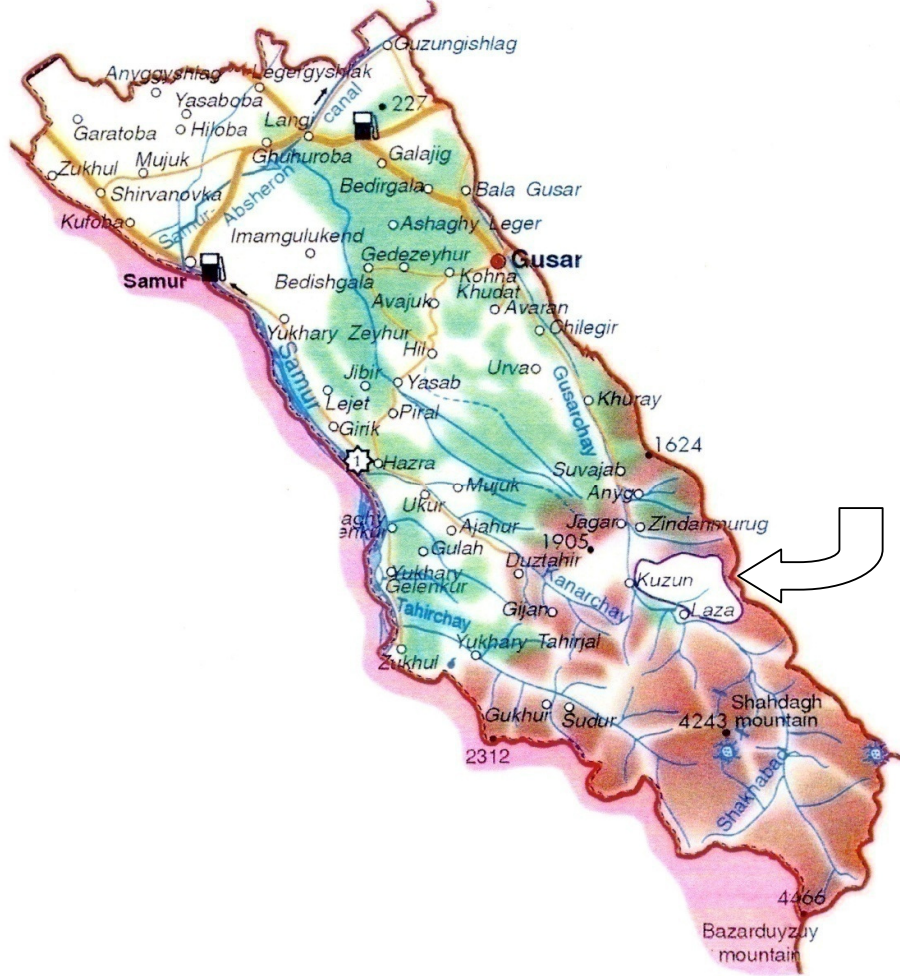
Şekil 3.1.: Şahdağ Kış Turizm Merkezi İçin Ayrılan Alan