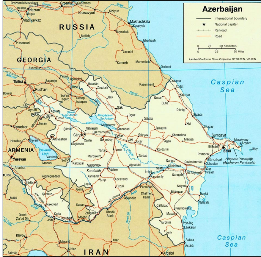
Şekil 2.2.: Azerbaycan'ın Ulaşım Haritası