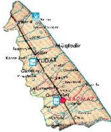
Şekil 2.5.: Haçmaz Rayonunun Haritası