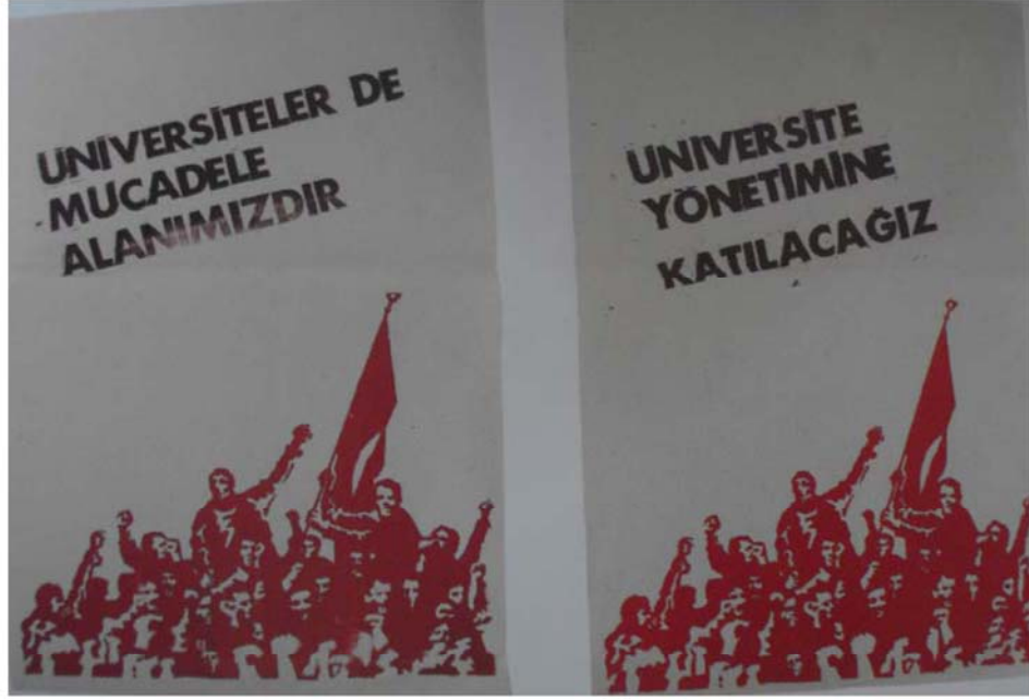
Resim 3.1: 1968 Hareketinde kullanılan bir afiş.

Kaynak: Yılmaz Aysan, '68 Afişleri, 2008.