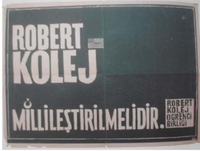
Resim 3.3: 1968 Hareketinde kullanılan bir afiş.