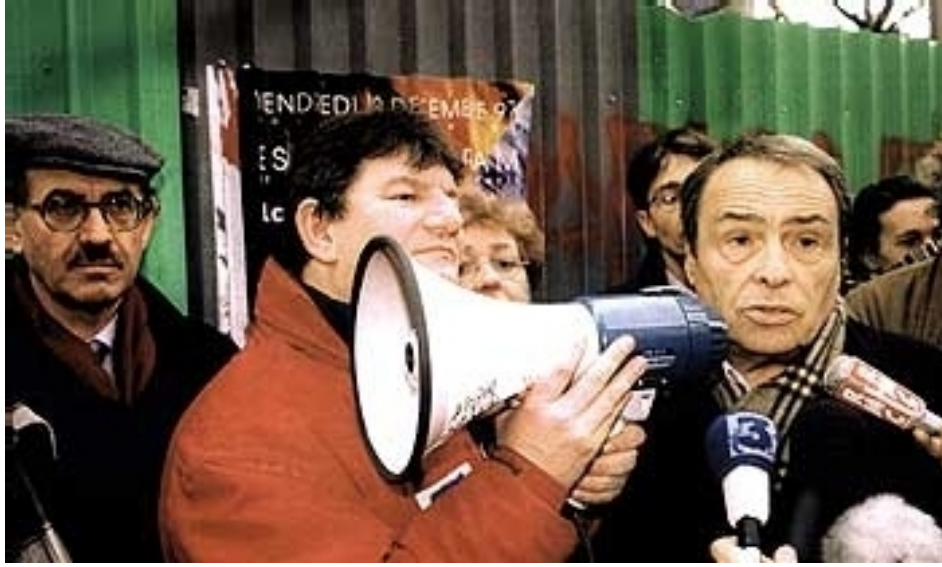
Şekil 1: 1995'te Lyon Tren İstasyonunda Gerçekleşen Eylemde Pierre Bourdieu