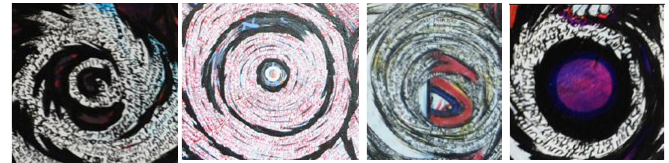
Resim 1 Resim 2 Resim 9 Resim 12

Şekil 3. Seçilen resimlerin bazılarındaki 'dalga' imgesi.