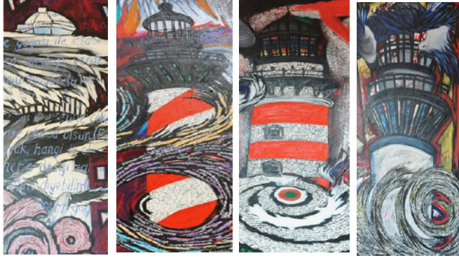
Resim 2 Resim 4 Resim 5 Resim 9

Resimlerdeki deniz feneri ve diğer göstergeler tek