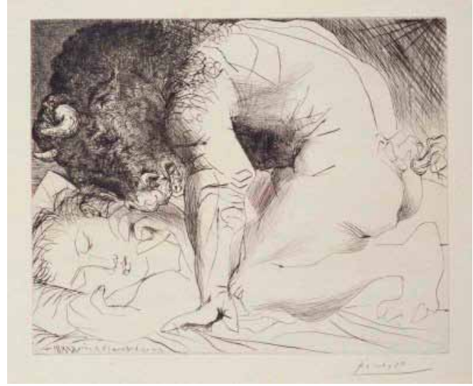
Resim 12. Pablo Picasso, 'Uyuyan Kadını Okşayan Minotaoros' 1933.

Kendinden geçmiş kadını kaçıran, ürpertici adam Notre-Dame'in kamburudur. Bu betimlemede hissedilen melankoli hali gargoyelerle benzerlikler gösteren bir özel-