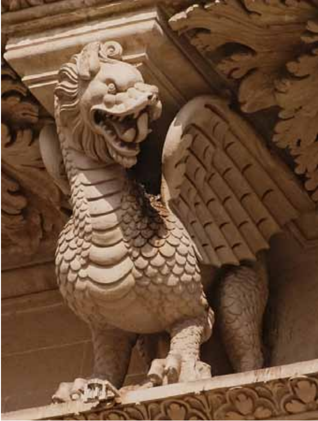
Resim 1. Santa Croce Bazilikası, ‘Ejderha’, güney cephe (Lecce) Floransa, İtalya.

Mekânla birebir ilişki kuran, boşluk ile var olan ve üç boyutlu özelliğinden dolayı nesnel olarak kavranabilen, günümüzde ise alışlagelen nitel ve nicel sınırlarını aşan heykel, Gotik dönemde plastik değeri kadar mistik tavrıyla da dikkat çekmiştir. Aynı dönem içinde, mimaride işlevsel özellikleriyle önemli bir yer alan gargoyle heykeller de nitelikleri ile sosyal ve kültürel yaşantıyı etkilemiştir. Öyle ki, İncil’de yer alan öğretilerin tiyatral anlatımı gibi görünen Grotesk üslupla süslenmiş gargoyle heykeller, kilisenin insanlar üzerindeki etkisini açıkça vurgulayan estetik objeler olarak varlıklarını korumaktadır. Plastik birer anlatı aracı olan bu gargoyle heykeller, betimleme, çözümlenme, yorumlama ve yargı süreci sonunda tıpkı bir metin gibi okunabilmektedir. Bu noktada, okuma sürecine etki eden göstergeler iyi değerlendirilmeli, birincil anlamlarının ardında yatan gizil anlamlar da değerlendirilmelidir.