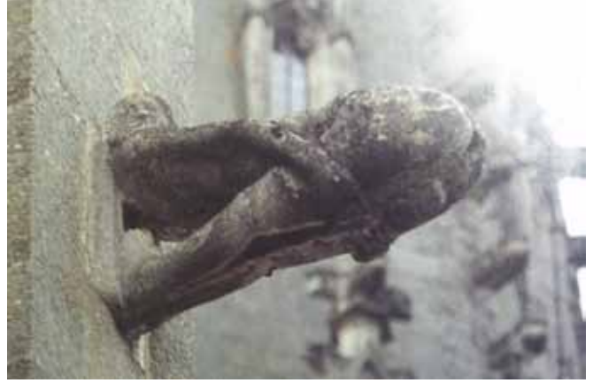
Resim 7. Autun Katedrali, 'Dışkılayan Figür' (Benton, 1997:62)

Ortak özellik olarak suyun drenajını sağlayan, Freiburg Manastırı ve Autun Katedrali'ndeki bu insan biçimli gargoyleler biçimsel ve işlevsel olarak diğer gargoylelerle benzerlik gösterebilir de, insanı şaşırtan bir kompozisyona bürünmüştür. Cennetten kovulan meleklerin birer göstergesi konumundaki bu iki insan biçimli gargoyle, Tanrı'nın yansı-