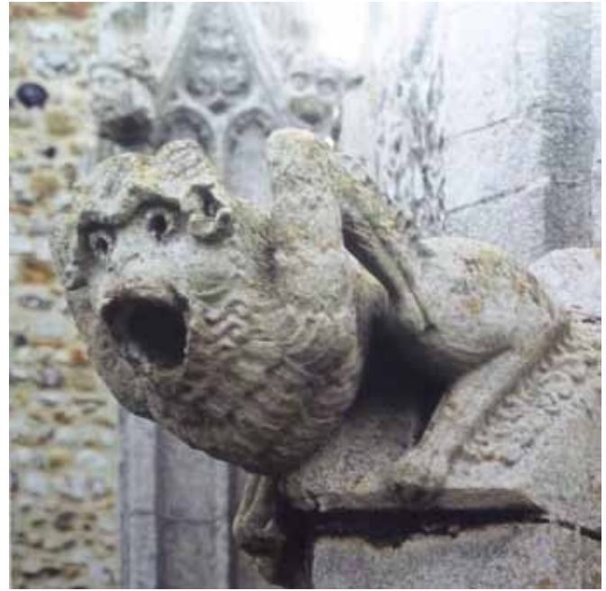
Resim 10. Parish Kilisesi, 'Gargoyle' (Benton, 1997:63)

Sanatçılar, doğada var olan keçi, kuş, maymun ve estetik bir değer biçtiği aslana olan bağlılıklarını gargoyelerde açıkça ortaya koymuştur. Gerçeğine uygun olarak yapılan bu yontularda bu hayvanların tüm özellikleri gargoyle biçiminde özetlenmiştir. Bunlardan bazıları alay eder gibi gülümserken bir kısmı da çılgın atarcasına ağızlarını açmış biçimde betimlenmiştir. Bilindiği üzere, doğal ortamlarında hayvanlar, kükremek, ulumak ve kur yapmak için ağızlarını açmaktadırlar, ancak, gargoyelerin açık ağızları onlara işlevsellik kazandırmaktadır (Res.10). Bu görüntüsel göstergeler dikkate alındığında fonksiyonelliğin önem kazanmasının yanı sıra, simge olarak gargoyeler, gerçek ile hayal ara-