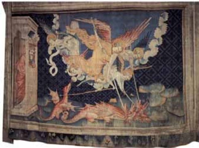
Resim 2. Jean Bondol, 'Meleklerin Ejderha ile Düellosu' 1377-78.

Gotik mimarinin önemli yapı öğelerinden olan gargoyle için, pek çok dilde farklı biçimlerde etimolojik çözümlenmeler yapılmıştır. Benton, gargoyle kelimesini şu şekilde yorumlar;