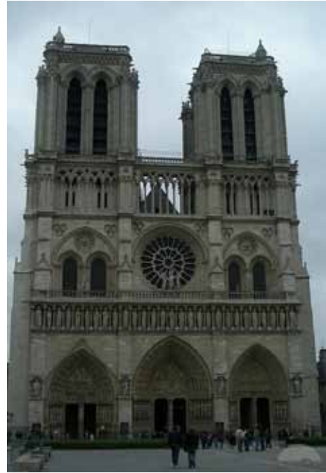
Resim 4. Notre Dame Kilisesi, batı cephesi, Paris, Fransa.

Bu örneklerden de anlaşılacağı üzere, Gotik mimaride binanın ağırlığı kemerlere ve fil payelere aktarılarak yapının tamamında kabartma, heykel gibi plastik elemanların yoğunlukta kullanılmasına olanak sağlanmıştır. Genel anlamda Orta Çağ sanatının özelde ise Gotik mimarinin