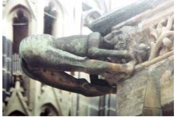
Resim 8. Freiburg Manastırı, 'Dışkılayan Figür' (Benton, 1997:63).

ması olan maddi dünya ve ona değer verenlerle adeta dalga geçmektedir. Bu sonuçtan destekle, bedenlerini arsızca katedrallerin duvarlarından dışarı uzatan bu gargoyleler maddi dünyanın tanrısal gerçeklik karşısındaki acizliğini vurgulamaktadır.