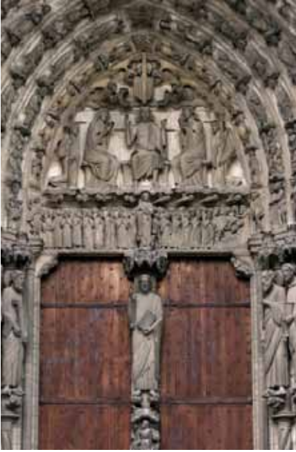
Resim 5. Chartres Katedrali, güney cephesi, orta taç kapı heykelleri, Fransa.

diğer bir özelliği de “simgesel bir anlatım biçimine sahip olmasıdır, yani kullandığı simgelerle aslında sergilediği biçimin içinde, özünde gizli olan başka bir konunun algılanmasını sağlayan bir anlatıdır. Gerçekte, bir katedraldeki süslemeler, yaratılmış evrenin tüm yaratıklarını temsil etmektedir” (Çınar, 2006:44).