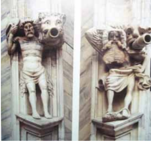
Resim 9. Santa Maria Katedrali, 'Gargoyle' güney cephe (Benton, 1997:67).

ğında tıpkı itaatsizliklerinden dolayı cennetten kovulan İblis ve melekleri gibi, Adem ve Havva akla gelecektir. Katedrallerin cephelerinde yer alan kadın ve erkek biçimli bu gargoyeler ile Adem ve Havva arasında bir ilişki kurulacaktır. Bu bağlamda bu sıra dışı kompozisyonlarıyla katedrallerin dış cephelerinde yer alan bu insan biçimli gargoyelerin yasak elmayı yiyerek cennetten kovulan Adem ile Havva'yı nitelediği söylenebilir.