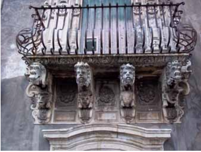
Resim 3. Catania Üniversitesi, Felsefe Bölümü, batı cephesi, Sicilya, İtalya.

gösterirler. Bu mimari dekoratif öğeler, çoğunlukla kilise ve katedrallerde görüldüğü gibi, sivil mimarilerin dış cephelelerinde de yer almaktadır (Res.3).