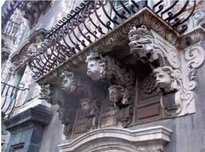
Resim 13. 'Grotesk', Catania Üniversitesi, batı cephesi, Sicilya, İtalya.

Orta Çağ grotesk tiyatrosu sihribazları, akrobatları,