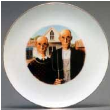
Resim 3. Howard Kottler, Benzerleri, 1972, Porselen Üzerine Çıkartma.

1960-70'lerde çağdaş seramik uygulamalarının da popüler bir dekor yöntemi haline gelen çıkartma tekniği, endüstride elek baskı tekniğiyle seri dekor uygulamalarında yaygınlaşırken, seramikçiler tarafından da kolaj malzemesi olarak tercih edilmeye başlanmıştır. Bu tekniği, özgün şekilde tüm çalışmalarında kullanan ve farklılıklarla gelişmesini sağlayan sanatçıların isimleri de bu teknikle özdeşleşmiştir. Konu ile ilgili çalışan sanatçılardan örnek verecek olursak, sanatsal çalışmalarda çıkartma tekniğine ilk kez Howard Kottler'in eserlerinde rastlanmaktadır.