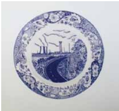
Resim 4. Paul Scott, 1997, Bone China Üzerine Sırıçi Çıkartma Uygulaması.

Paul Scott, seramik yüzeylerde baskı tekniklerinin uzmanı ve çıkartmayı birçok uygulamasında kullanan bir çağdaş seramik sanatçısı olarak seramik ve baskı alanındaki