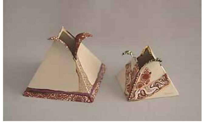
Resim 9. Sibel Sevim, Stoneware, Piramit Formlar Üzerinde Çok Renkli Çıkartma Uygulaması.

Sibel Sevim'in formları üzerinde vazgeçilmez dekor