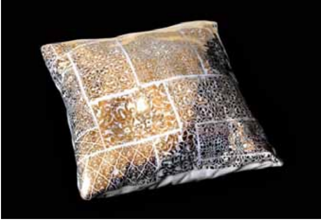
Resim 8. Zehra Çobanlı, Altın Yıldız Çıkartma Uygulaması.

Çıkartma tekniğinde kolaj yaklaşımının kullanım eşyaları dışında artistik seramik formlarda da etkili biçimde kullanıldığı görülmektedir. Bu tekniği özgün biçimde kullanan seramik sanatçıları arasında bulunan Zehra Çobanlı'nın çalışmalarında kullandığı geleneksel çini desenlerinin renk ve biçim olarak orijinallikini koruduğu dikkat çekmektedir. Sanatçı, farklı biçimlerde kesilen çıkartma desenlerinin yeniden bir araya getirilmesiyle yeni öneriler sunmaktadır.