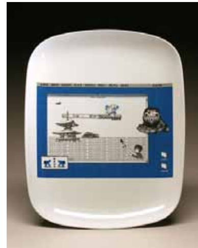
Resim 13. Scott Rench, Dijital Baskı.

Dijital olarak basılan çıkartma desenlerinde mürekkep kalınlığı ve yoğunluğu daha az tutulduğundan, daha açık ve solgun etkiler vermektedir. Serigrafide yapılan baskı daha doygun bir boya tabakası oluşturarak çıkartmanın seramik yüzey üzerindeki etkinisinin daha koyu ve kalın bir katmana dönüşmesini sağlamaktadır.