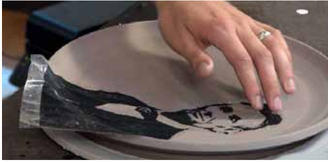
Resim 11. Justin Rothshank, Yaş Bünye Üzerinde Çıkartma Uygulaması.

basılan görüntü daha sonra sprey ya da elek yöntemiyle lak ile kaplanmaktadır. Eğer basılan kâğıt laklı çıkartma kâğıdı ise çıktı alındıktan sonra çıkartma yüzeye transfer etmek için hazır olmaktadır. Bu yöntemde kullanılan lazertran kâğıdı lazer yazıcı ya da fotokopi makinası mürekkepleriyle kullanılmak üzere üretilmiş özel bir üründür ( http://www.lazertran.com ). Bilinen klasik yöntemle sırlı yüzeylere uygulanabilen bu tür çıkartmalar 200 C'de pişirilebilmektedir.