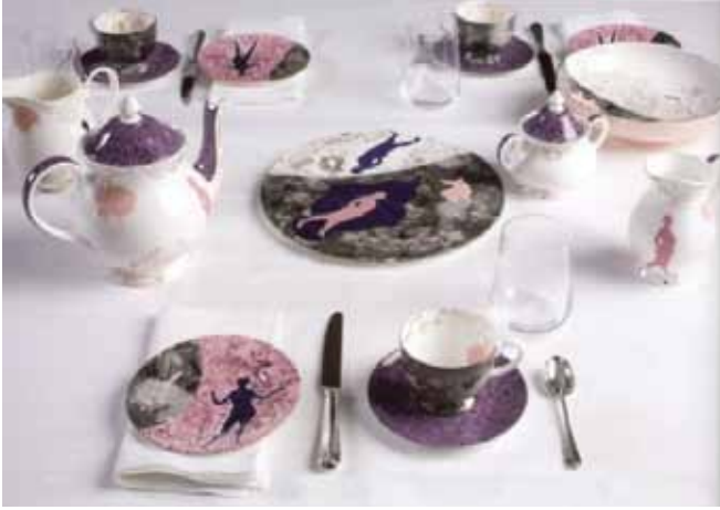
Resim 7. Charlotte Hodes, Elde Kesilmiş Çıkartmalarla Dekorlanmış 14 Parça Yemek Takımı.

yaklaşımların yanı sıra sofraya eşyaları gibi günlük hayatımızın parçası olan işlevsel formlarda bile özgün bir estetik sunmaktadır. Bunun için renk ayrımı yapılarak her renk için ayrı baskı gerçekleştirilmektedir (Quinn, 2007:64).