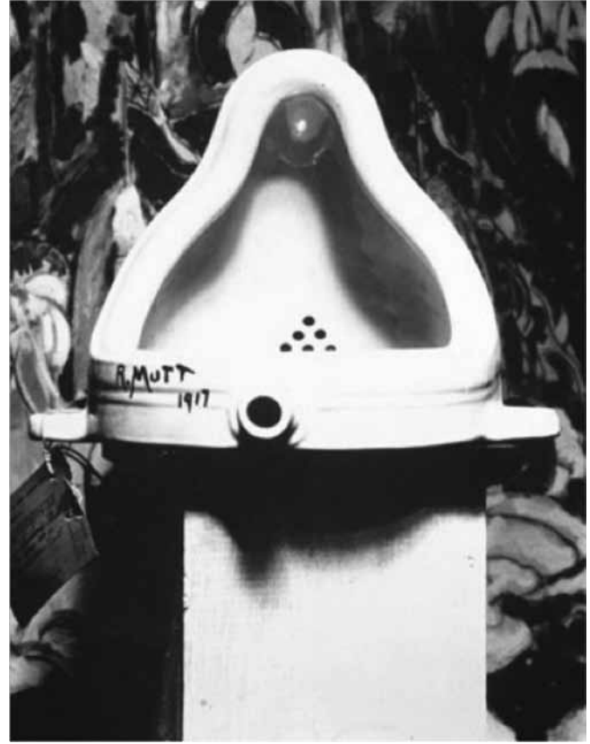
Resim 1, Alfred Stieglitz tarafından çekilmiştir, 1917 Kaynak: http://www.moma.org

deyse hepsine öncülük etmek suretiyle sanatı olduğu yerden farklı bir yere taşımıştır. Duchamp'ın asi tavrının bu ürünü, içeriğin yanı sıra, sanatın modern çağlarda sergi, jüri, yarışma, ödül gibi sanatın ve sanatçının değerini düşüren piyasa oyunlarına mükemmel bir karşı çıkıştır.