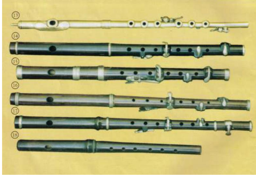
Resim 20. Pikolo Flütler - 3