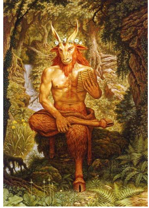
Resim 8. 23