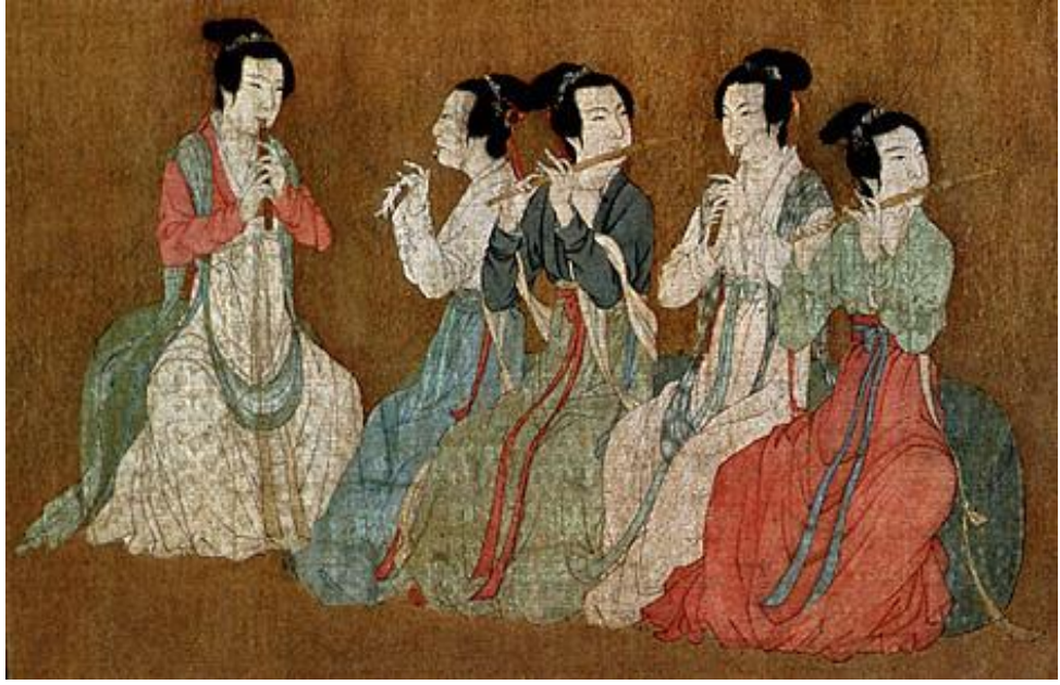
Resim 3. Flüt Çalan Çin'li Kadınlar 14

Buluntular "chi" sembolünün zaten milattan önce de var olduğunu gösteriyordu.