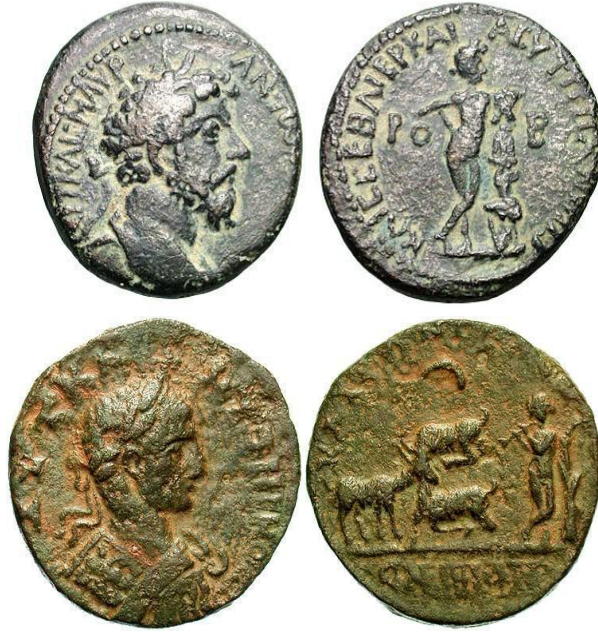
Resim 6. Flütün Resmedildiği Bozuk Para Örnekleri 19

Transversal flüte dair en eski ve belirgin resim Perusa yakınlarındaki Etrüsk kabartmalarında görülüyordu. Bunun meydana gelişi milattan önce 2. veya 3. yüzyıllarına denk gelmekte. Etrüsklerin flütü ne kadar çok sevdiğini ve benimsediğini kültürlerine dair arkalarında bıraktıkları bir çok resimde görmek mümkün.