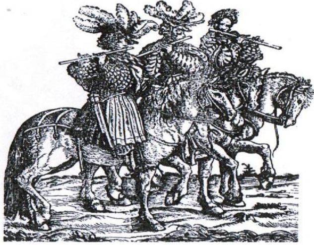
Resim 11. At Üstünde Fifre Çalanlar 39

(Hans Burgkmair'in The Triumph of Maximilian isimli ağaç baskısı)