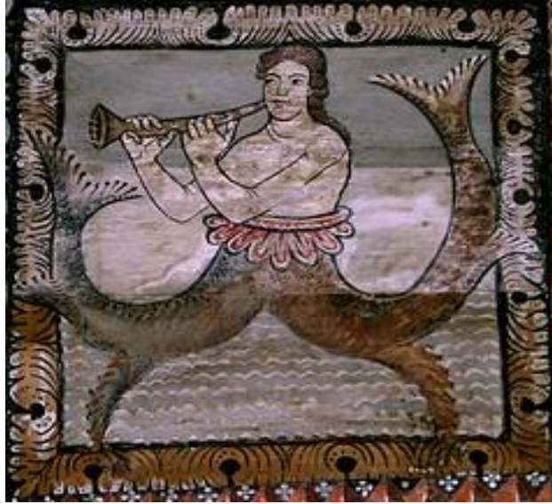
Resim 9. Flüt Çalan Siren

Batıya özgü buluntular 12. ve 14. yüzyılları arasındadır. En eski tasvir Landsberg'deki Hortus Deliciarum adındaki katedralde bir manastır el yazmasında resmedilmişti. Bu yazmada flüt, Yunan Mitolojisinde denizcileri şarkılarıyla büyüleyerek kayalıklara sürdükten sonra kendilerine yem ettiği belirtilen deniz yaratığı Siren (Yunanca; Σειρήνες) tarafından çalınıyordu. 26