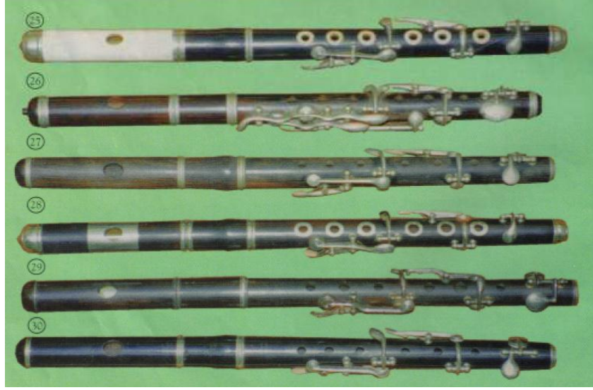
Resim 22. Pikolo Flütler - 5