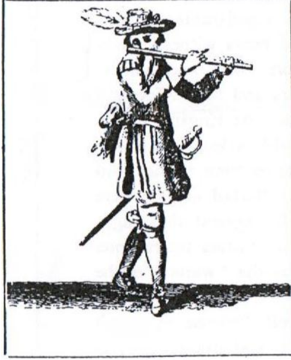
Resim 14. Fifreci (17. yüzyıl) 51

“Orchesographie” (1588) eserinde Tabourot fifre çalanlara enstrümanı tamamen kendi zevkleri için çalmalarını ve davulun ritmine uyum sağladıkları sürece bunun yeterli olduğunu söylemiştir. Davula gelince, “Five Decades of Epistles of Warre” (1622) eserinin yazarı Markham davul hakkındaki kullanım kılavuzları için bunların gereksiz çalışmalar olduğunu söylemişti. Burada yer alan talimatlarının, uygulandıkları taktirde, bu davul ve fifre bandolarına hemen hemen hiç katkısı olmayacaktır. Fakat, ne Tabourot ne de Markham tam olarak bunları kastetmiş olamazdı çünkü Tabourot bizlere davul ve fifre müziğine dair birçok önemli örnek bırakırken, Markham davul ve fifre kullanımına hatırı sayılır bir zaman ayırmış ve dahası “davul ve fifrenin sağladığından daha tatlı ve vakur bir ses” daha duymadığına da tanıklık etmiştir. 52