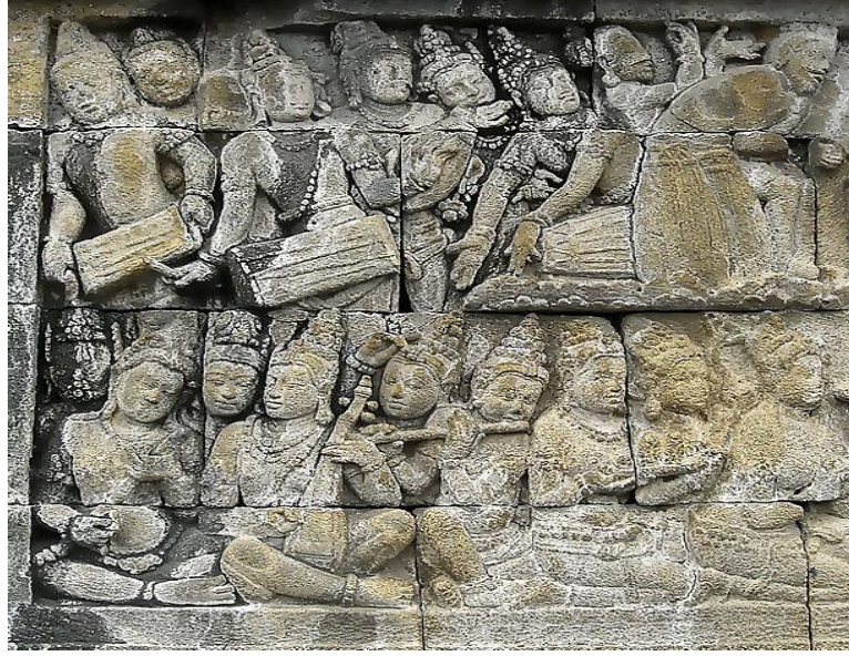
Resim 4. Java-Borobodur Tapınağıdaki Bir Kabartma 16

Eski Yunanda ise görüldüğü kadarıyla flüt bilinmiyordu. Flüt anlamına gelen “Photinx”, Helenistik döneme kadar ortaya çıkmamıştı. Dönemin filozofları flütün açıkça insanlar üzerinde “feminenlik ve ahlak bozukluğu” gibi kötü etkilere neden olduğunu düşünüyorlardı. 17