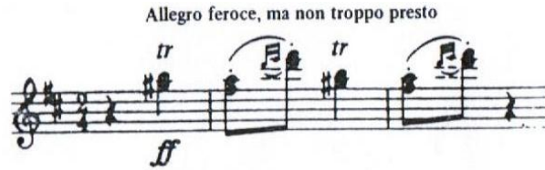
Resim 16. Der Freischütz 65

Pikolo flütün ikinci işlevi ise çeşitli türdeki "doğaçlamalar" ile melodiyi süslemektir. Bu nedenle, melodik bir enstrüman olmaktan çok süs çalgısı olarak ün yapmıştır. Bunun güzel bir örneği Weber'in Der Freischütz'ündeki iki adet pikolo flüt çalınan kısımdır.