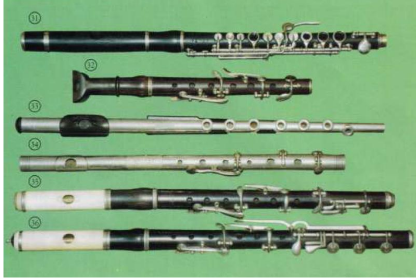
Resim 23. Pikolo Flütler - 6