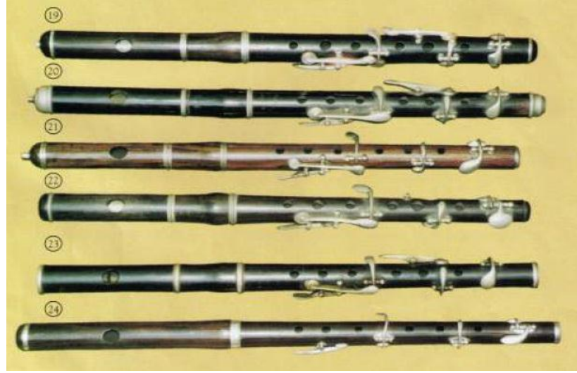
Resim 21. Pikolo Flütler - 4