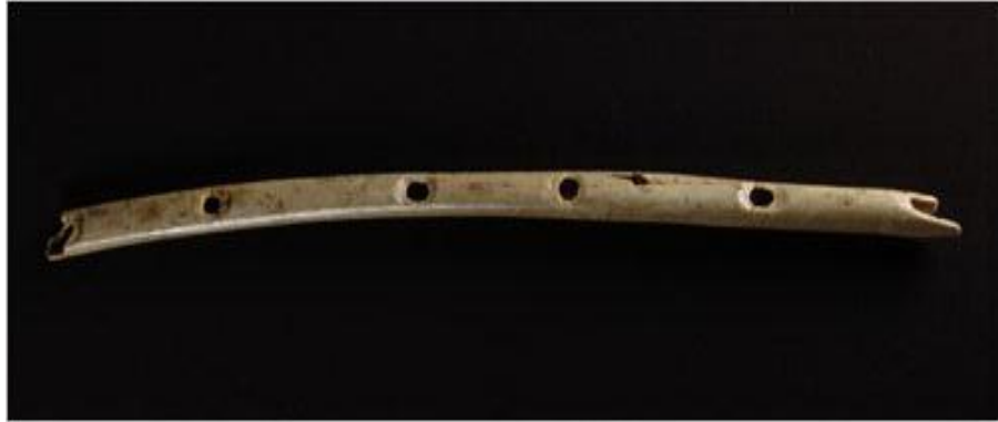
Resim 2. Mamut Dişinden Yapılmış Flüt 13

İlk buluntulara Almanya'nın güneyinde rastlanmıştı (Blaubeuren yakınlarındaki Geißenklösterle'de). Bulunan flütler 35.000 yaşında ve mamut dişinden yapılmıştı. Bunların yanısıra, kuş kemiklerinden yapılan çalgılarda bulunmuştu fakat flütler, pekte uzun ömürlü olmayan materyallerden üretilmekteydi, bu nedenle veriler kuşkusuz kanıtlanamıyordu. 12