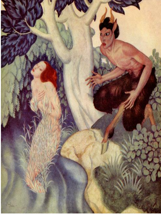
Resim 7. 22

“Syrinks” veya “Pan Flüt” ortaya bu şekilde çıkmıştı. Böylelikle Pan, Syrinks'i yanından asla ayırmıyordu. Bütün gün ormanda oynuyor ve onunla güzel melodiler çalarak ormanı güzel melodileriyle dolduruyordu. Fakat insanlar da onun dış görünümünden Syrinks gibi korkuyordu bu nedenle ise ”Panik” kelimesi Pan'ın isminden türemiştir. 21