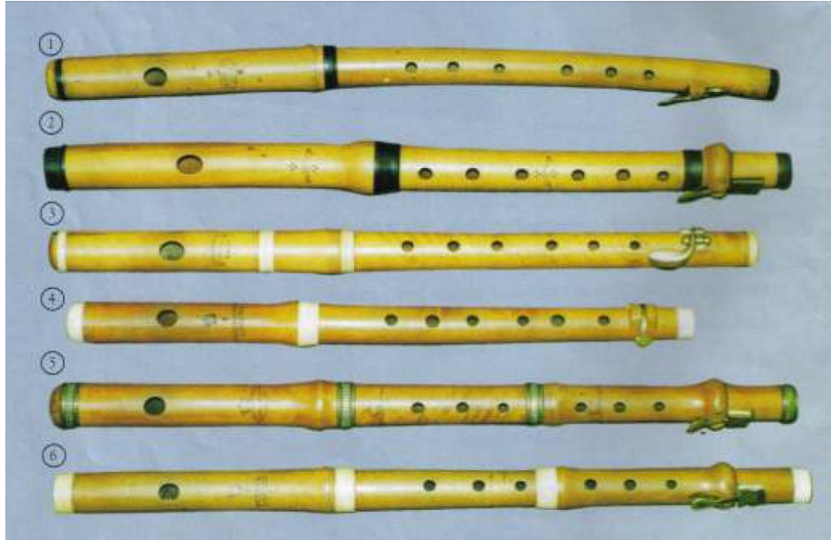
Resim 18. Pikolo Flütler - 1

Aşağıda göreceğiniz resimler tarih boyunca kullanılmış ve müzelerde sergilenen pikololardır. Üretildiği firma, şehir, ülke veya üretim tarihi ile ilgili bilgiler parantez içerisinde, üretimde kullanılan malzeme ve ek özellikler de listelenmiş olarak belirtilmiştir.