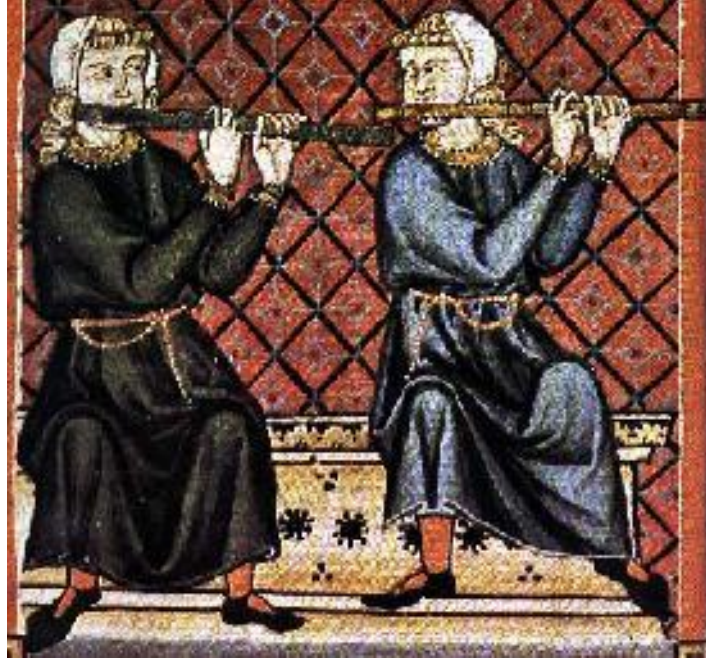
Resim 10. Manesse El Yazmalarından 30

Ortaçağ enstrümental müziğine dair ne yazık ki çok az kaynak var. O zamanlara ait en bilindik şey flütün “low ensemble” olarak bilinen ve sadece özel etkinliklerde çalan bir grubun üyesi olduğudur.