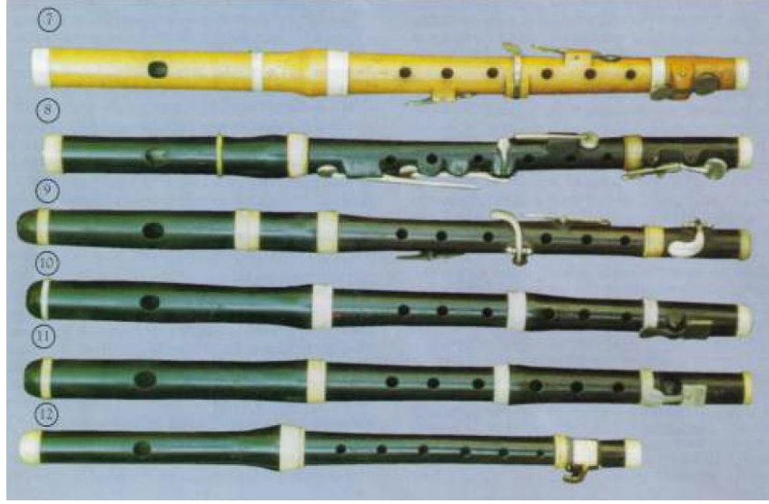
Resim 19. Pikolo Flütler - 2