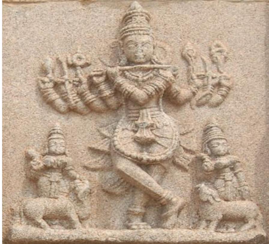
Resim 1. Krishna 11

Öyle görünüyor ki transversal flüt icad edilmiş flütlerin en sonuncusudur. Bazı kaynaklara göre bu çalgının Avrupa'ya koyunlarla beraber göç eden orta asyalılarla birlikte geldiği inanılıyor. Tahminen taş devrinin sonlarında kendini gösteren flüt Antik Çağlar zamanında ender rastlanan bir çalgıydı. Diğer yandan flütün iki ayrı bölgede birbirinden bağımsız olarak gelişim gösterdiği de malum. 10