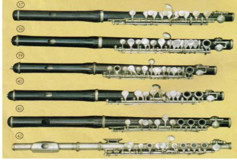
Resim 24. Pikolo Flütler - 7