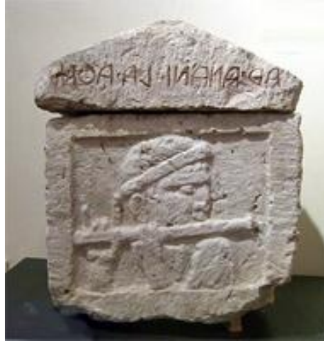
Resim 5. Etrüskler Tarafından Yapılmış Kül Saklama Küpü 18

Eski Yunanda ise görüldüğü kadarıyla flüt bilinmiyordu. Flüt anlamına gelen “Photinx”, Helenistik döneme kadar ortaya çıkmamıştı. Dönemin filozofları flütün açıkça insanlar üzerinde “feminenlik ve ahlak bozukluğu” gibi kötü etkilere neden olduğunu düşünüyorlardı. 17