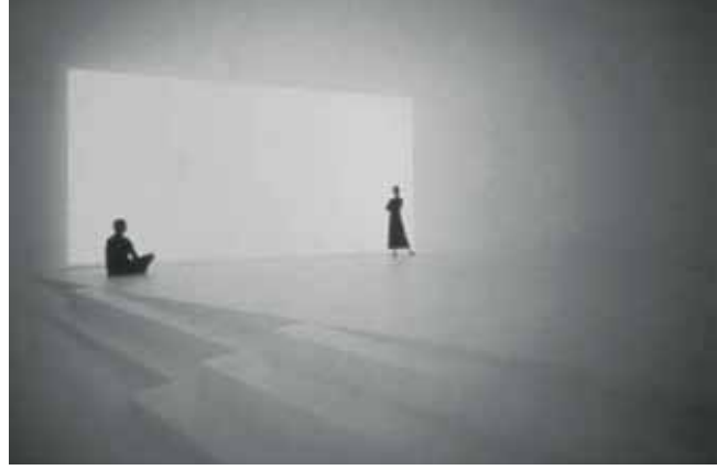
Resim 4 , James Turrell, Wide Out 1998 Michael Hue-Williams Fine Art ve MAK Vienna