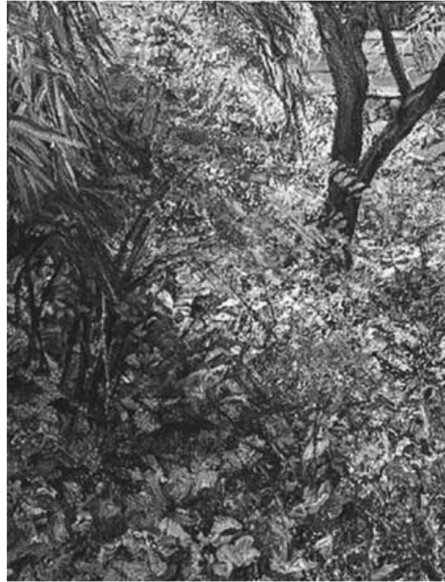
Resim 10 , Lucian Freud'ün Bahçesi, 2003 Acquavella Galerileri