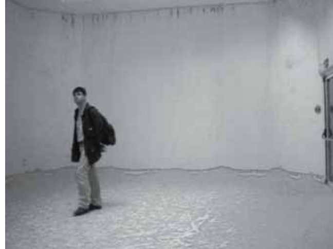
Resim 1, Ann Hamilton, Myein

şisi çöker. Bir Yeni Eski Ustanın çalışması yüzeyde ideolojik görünebilir ancak etkisi varoluşsaldır. Kavramsalcılık ve Minimalizm bilinçdışı fanteziden ve yoğun duygudan, günlük yaşamda belli belirsiz ortaya çıkan esrarengizden ve beklenmedik bir biçimde rahatsız eden - Yeni Eski Ustaların çalışmalarında dramatik olarak geri dönen – tutkularından kaçır. Duygu Ann Hamilton'un Venedik yerleştirmesindeki toza indirgenir: Gerçekten önemli olan boş mekân, beyaz duvarlar ve siyasi kavramlardır. Etkili olan şey yerleştirmenin Minimalizmi ve entelektüel doğruluğudur.