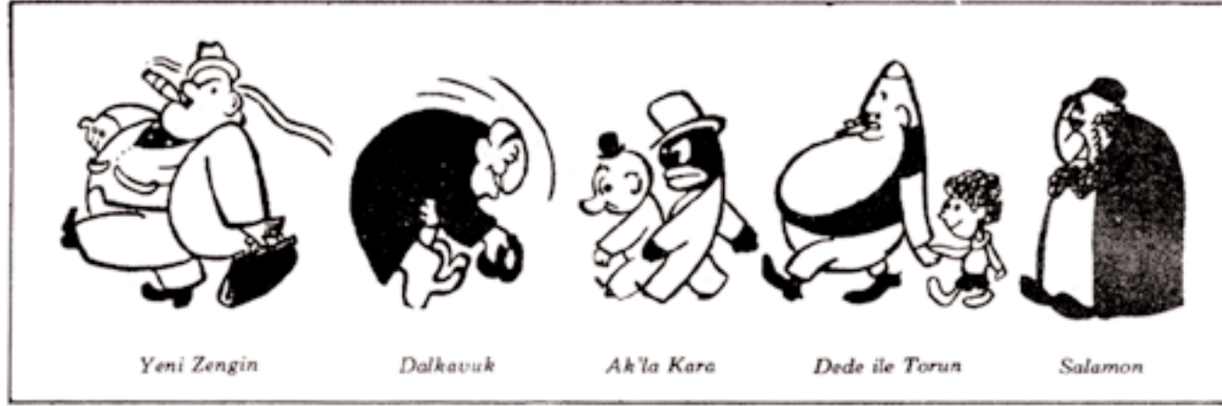
Şekil 5 - Cemal Nadir'in tipleri

kadınların ve fôtr şapkalı, devasa göbekli erkeklerin dünyasıdır (şekiller: 1, 2, 3, 4, 5). Siyasi bir sistem olarak görünüşte çökmüş olan Osmanlı, toplumsal yaşamda varlığını bütün gücüyle sürdürmekte, üstelik buna ulusal, merkezi devletçi yapı ve İkinci Dünya Savaşı'nın getirdiği ekonomik durgunluk ve yokluklar eşlik etmektedir. Cemal Nadir bu dünyayı gayet iyi tanımaktadır: