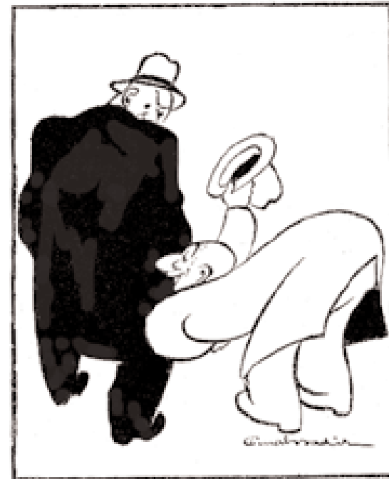
Şekil 2 - Hadi oradan odun Herif! - Teveccühünüz efendim!"

diğinde Türk karikatür sanatının ilk büyük ustası olarak kabul edilen, Cumhuriyet öncesi çizerlerinden ressam Cemil Cem'in büyük etkisi açık bir şekilde görünür. Cem'in etki ve esin kaynağı ise on dokuzuncu yüzyılın ünlü Fransız karikatür çizeri Carand'ache'dir. Bu isim, zamanın çizerleri arasında 'Karındaş' olarak, dilimize uygun hale getirilerek kullanılmakta ve çok sevilmektedir. 'Carand'ache üslubu karikatür', temelde figür ve perspektifin alabildiğine abartıldığı, figürlerin dış çizgilerinin oldukça kalın tutulduğu bir karikatür üslubudur ve esas kaynağı daha da eskilere, Leonardo Da Vinci'nin bin beş yüzlü yıllarda yaptığı çizimlere kadar gitmektedir. Çizgilerin kalın ve koyu olmalarının nedeni baskı teknolojisinin dikte ettiği bir zorunluluktur aslında. Türkiye'de gazeteler, yetmişli yılların başlarına kadar klişe baskı tekniği ile basıldıkları için, karikatürler önce kalın kesik uçlu kalemle kâğıda çizilmekte, sonra bunların çinko kalıpları hazırlanmaktaydı. Yani, karikatür figürlerinin dış çizgileri ne kadar kalın olursa, seri baskı sırasında kâğıda geçme şansları o kadar yüksek olmaktadır. Zamanla bu kesik uç yöntemi gazete ve dergilerde, fotoğrafik ofset baskı sistemine geçilmesi ile birlikte artık gereksiz olduğu halde estetik bir kaygı ile göze hoş görüldüğü için devam ettirildi ve hala da sürdürülmekte-