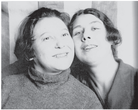
Resim 1: Varvara Stepanova ve Liubov Popova, 1924

Popova'dan beş yaş küçük Stepanova, onun kadar köklü bir eğitim almamış, Kazan'daki Sanat okulunda okuyup, 1913 yılından sonra Moskova'ya taşınmıştı. Geleneksel fügüratif tarz üzerindeki yorumları, onun resimden çok tekstil tasarımı-