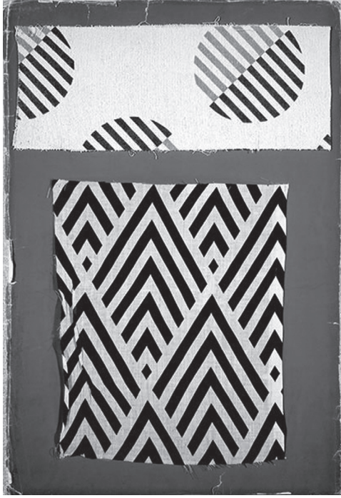
Resim 5: Kumaş örnekleri, Lyubov Popova, 1923-1924, State Tretiakov Gallery, Moscow

çıkan sanatçı, emekle özdeşleşmiş işçi tulumunu yüceltmıştır. Yeni sistemde giysi: “burjuva değerlerinin bir göstergesi olarak değil, toplumun örgütlenmesinde işlevsel bir unsur olarak yer almalıdır” düşüncesi vurgulanmıştır.