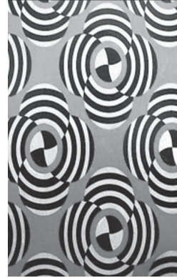
Resim 2: V.Stepanova tasarımı, 1924

vatandaşlarına siyasi propoganda ve ajitasyon aracı olarak satılmışlardır. Üç renk ve üç elmandan fazla tasarım öğesi içermeyen bu tasarımlarda buğday başağı, orak, çekiç gibi amblemler de kullanılmıştır(15). Vkhutemas'da Stepanova ve Popova'nın yanı sıra Alexander Rodchenko, Vladimir Tatlin, Lazar El Lissitzky