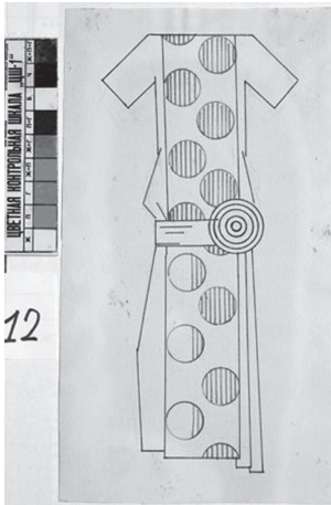
Resim 8: Liubov Popova, giysi tasarımı, SMCA.

Sanatın günlük yaşamın her alanında olması gerektiğini savunan bu sanatçılar, resim ve tekstil dışında sahne tasarımı gibi alanlarla da uğraşmışlardır. Popova, 1921 yılında tiyatro oyunları için yaptığı sahne ve kostüm tasarımlarında, hareketli sahne ile oyuncuya daha fazla yer bırakarak oyun ve seyirci arasında ilişki kurulmasını sağlamıştır(20). Bu uygulaması, Brecht'in epik tiyatrodaki seyirci-oyuncu yaklaşımından esinlendiğini ve seyirciyi düşündürmeye yönelik oyuna dahil etme anlayışından hareket ettiği çağrıştırmaktadır.