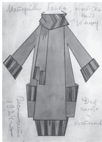
Resim 9: Popova, manto tasarımı, 1923-24

Dönemin Art Deco havasını yansıtan Resim 9'daki manto tasarımında olduğu gibi Popova'nın tasarımlarıyla, çağdaşı Sonia Delaunay'ın tasarımları arasındaki paralellik, sanatçının uluslararası moda eğilimlerini takip ettiğini göstermektedir. Sonia Delaunay haute couture üretim yaparken; Popova herkes için üretmeye çalışmış ve yeni ulus adına yeni tarzın oluşması için büyük çaba göstermiştir(21). Bu durumda teknolojik, ekonomik ve sosyolojik olarak