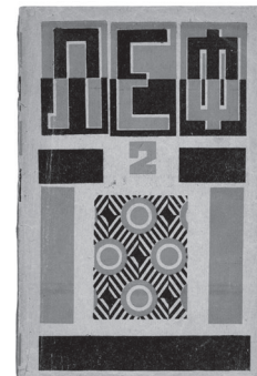
Resim 10: Popova Kumaş tasarımı, Lef Dergisi Kapağı, no.2, 1924

İlk Devlet Baskı Fabrikası için ürettiği, günümüze kadar çağdaşlığını kaybetmeyen kumaş tasarımları, erken yaşta ölen sanatçının son çalışmaları olmuştur.