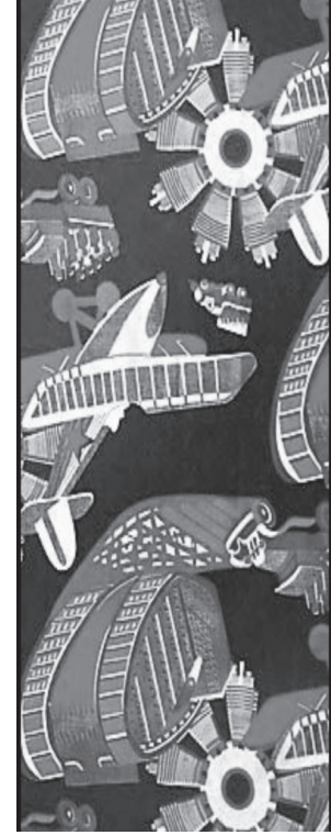
Resim 4: L.Raitser, 1933