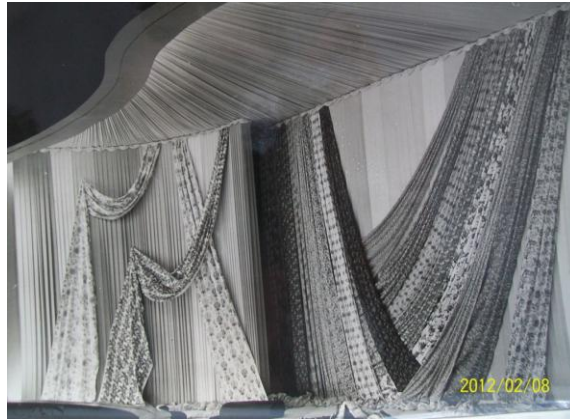
Fotoğraf 1- İzmir Enternasyonal Fuarındaki sergi alanı (Şark Sanayii Fabrika Arşivi1982)

1930 Sanayi Kongresinde sunulan İzmir raporunda ise fabrikanın üretim kapasitesi verilmektedir; "Fabrikada 22 000 masura bulunmaktadır. 170 erkek 350 kadın olmak üzere toplam 520 işçi çalışmaktadır. Fabrika 4-24 numara iplik üretiminde yeteneklidir. Yılda her biri 4,5 kilo ağırlığında 250 000 paket iplik üretir. Yani yaklaşık olarak 1,5 milyon kilodur. Bu üretim için de 7 bin balya pamuk sarf etmektedir. İmal ettiği kalın iplikler halı çözümlerinde ve 10 numaradan yukarı olanlar Denizli çevresinde ve diğer şehirlerde el tezgâhlarında ve özellikle alaca dokumacılığında çarşaf ve peşkir imalinde kullanılmaktadır. Fabrikada 1929 senesinden itibaren 110 tezgah ile kaputbezi imaline başlanmıştır." (1930 Sanayi Kongresi Raporlar Zabıtlar, 2008, 44.s.) Şirket 1976 yılında iflas ederek kapanmasına kadar İzmir'in büyük tekstil fabrikalarından biri olarak iplik, dokuma ve baskılı bez (Fotoğraf 1) üretimini sürdürmüştür.