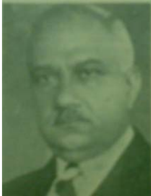
Recep Peker CHP Genel Sekreteri