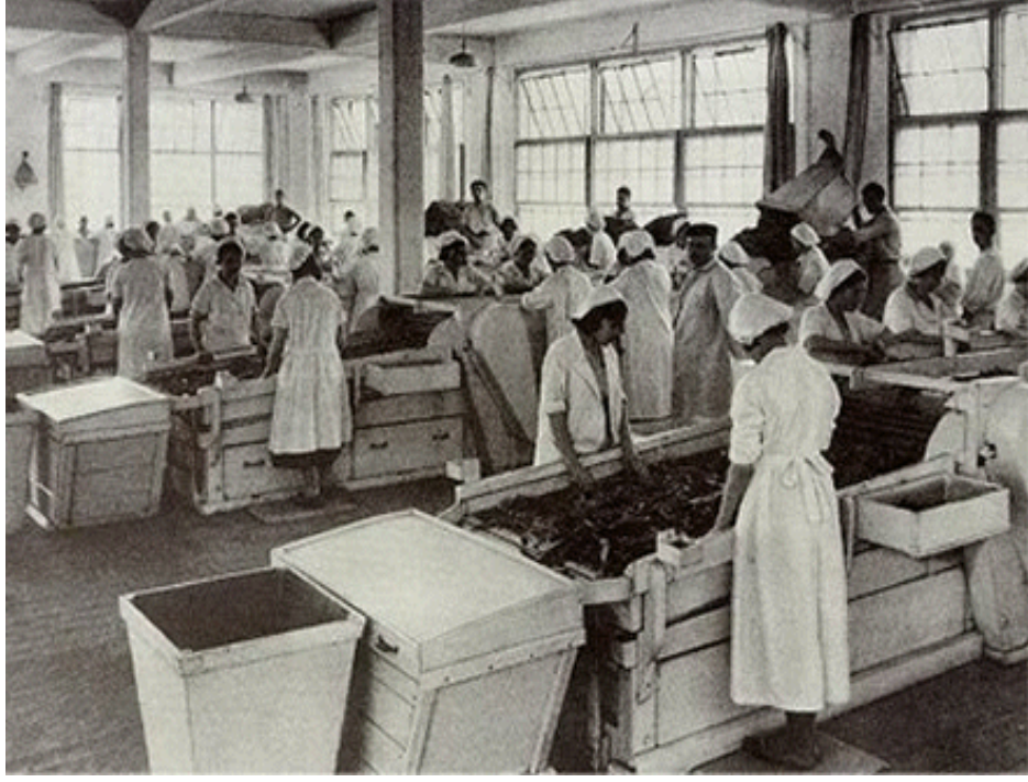
İzmir Tütün Fabrikasında Çalışan Kadınlar (1935)