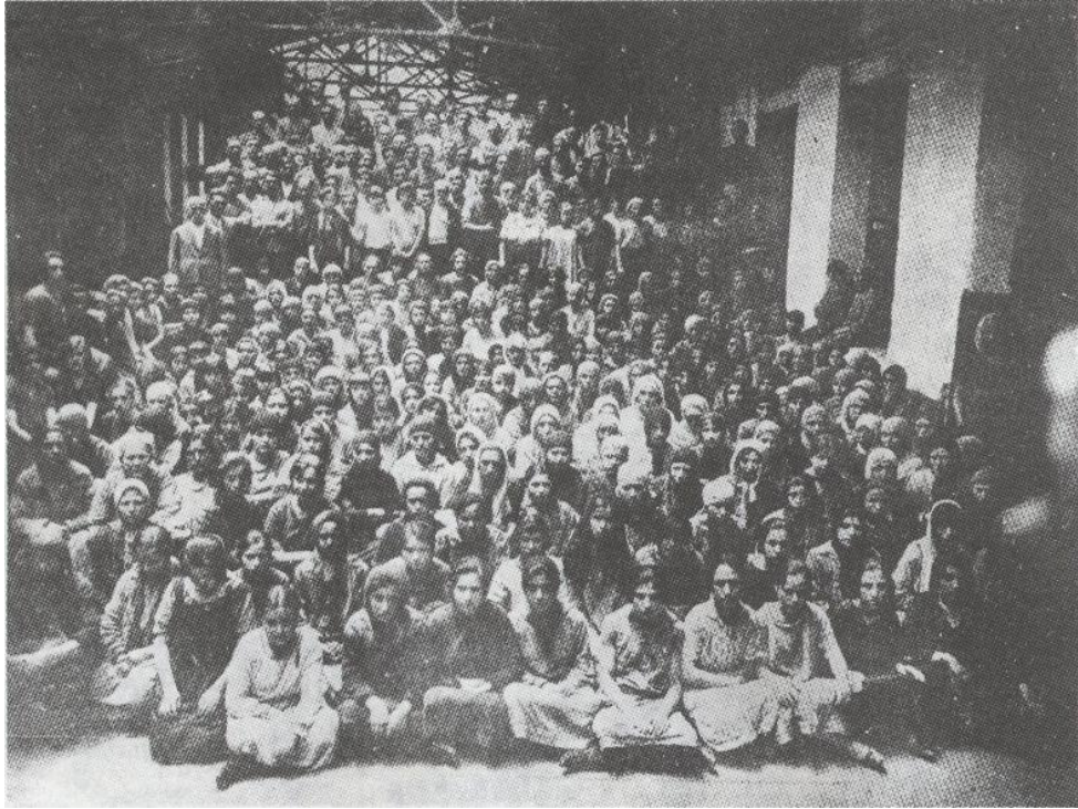
Cibali Tütün Fabrikasındaki Greve Giden Kadın İşçiler