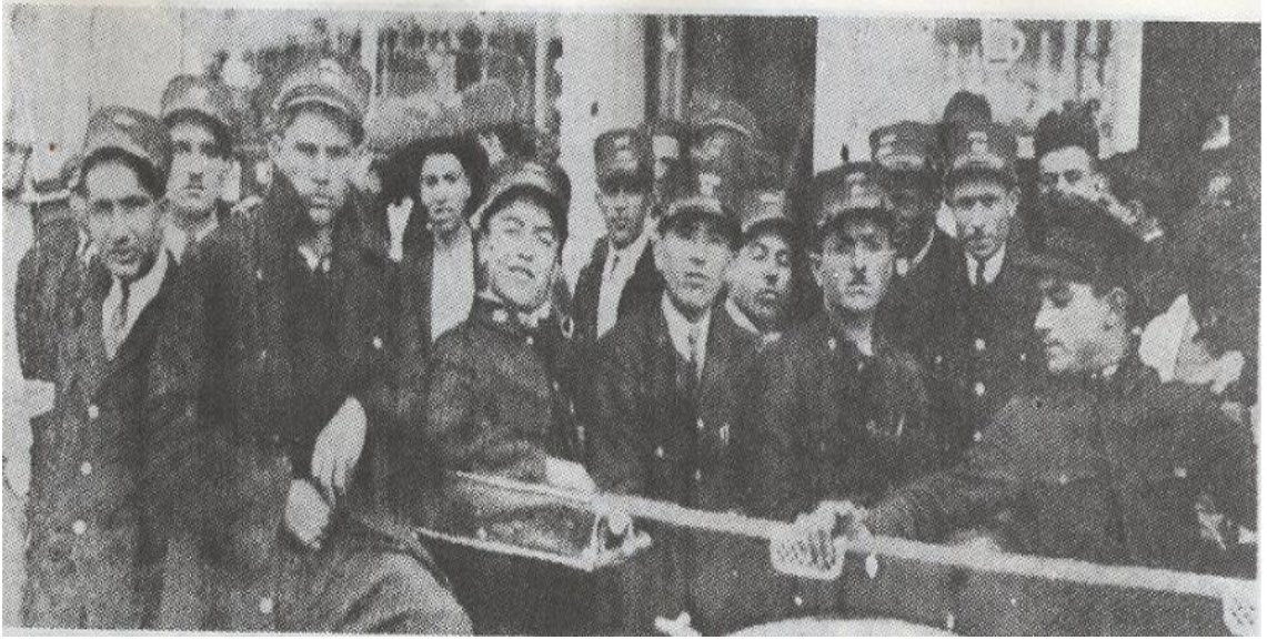
1910 Yılında Tramvay İşçilerinin Grevi