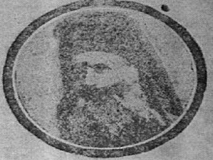
آناطوليه تورك اوردووسى قلميا طابى اولدغى يونانلى باباس ( مله تيسوس )

آتمه ، ۲۲ ( ن ) — ( تايس ) و ( دهنى تفراف خرنلرته نظراً ، نورد ( سهيل ) عوام قاره سنده ، جهاك آناطوليه مضطرب ( ۱ ) بولونلا خرىستيان اهالى قارشو دري توجهات بوردو ايتديكي تكليفه اشراك ايتديكى درميان ايتتىز و مذكور خرىستيانلر يادريم ايملك اوزره تدابير اشخاىي حكومتدن طلب اولمشدر .