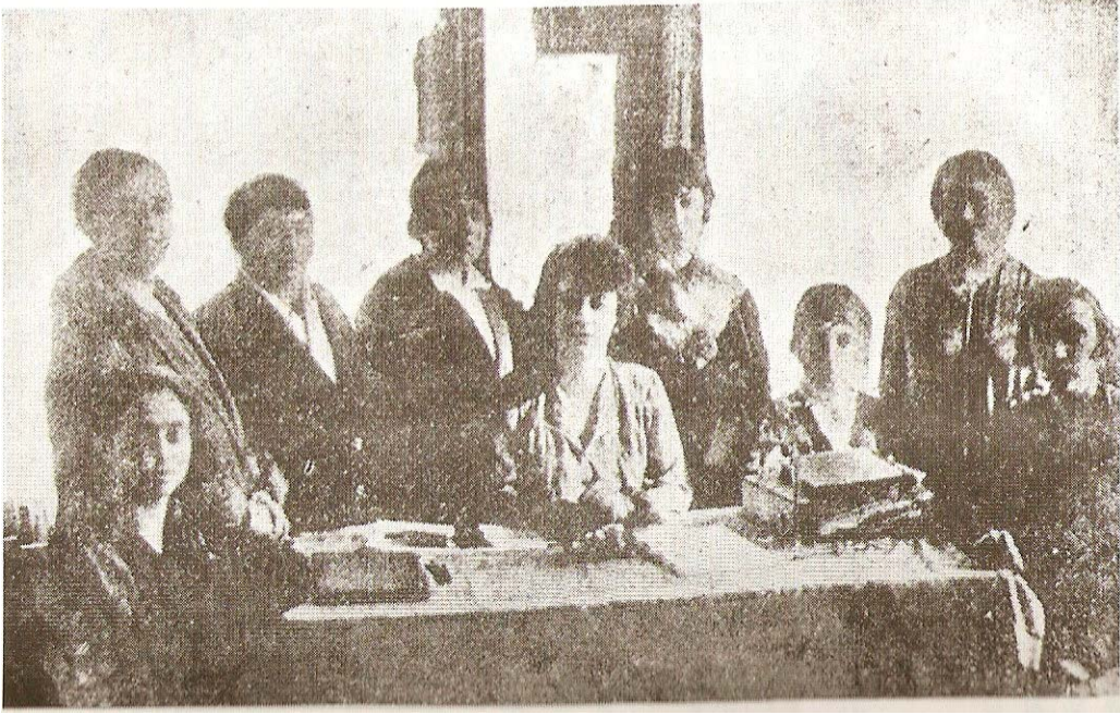
Kadın Birliđi'nin İlk Heyet-i Azası 1