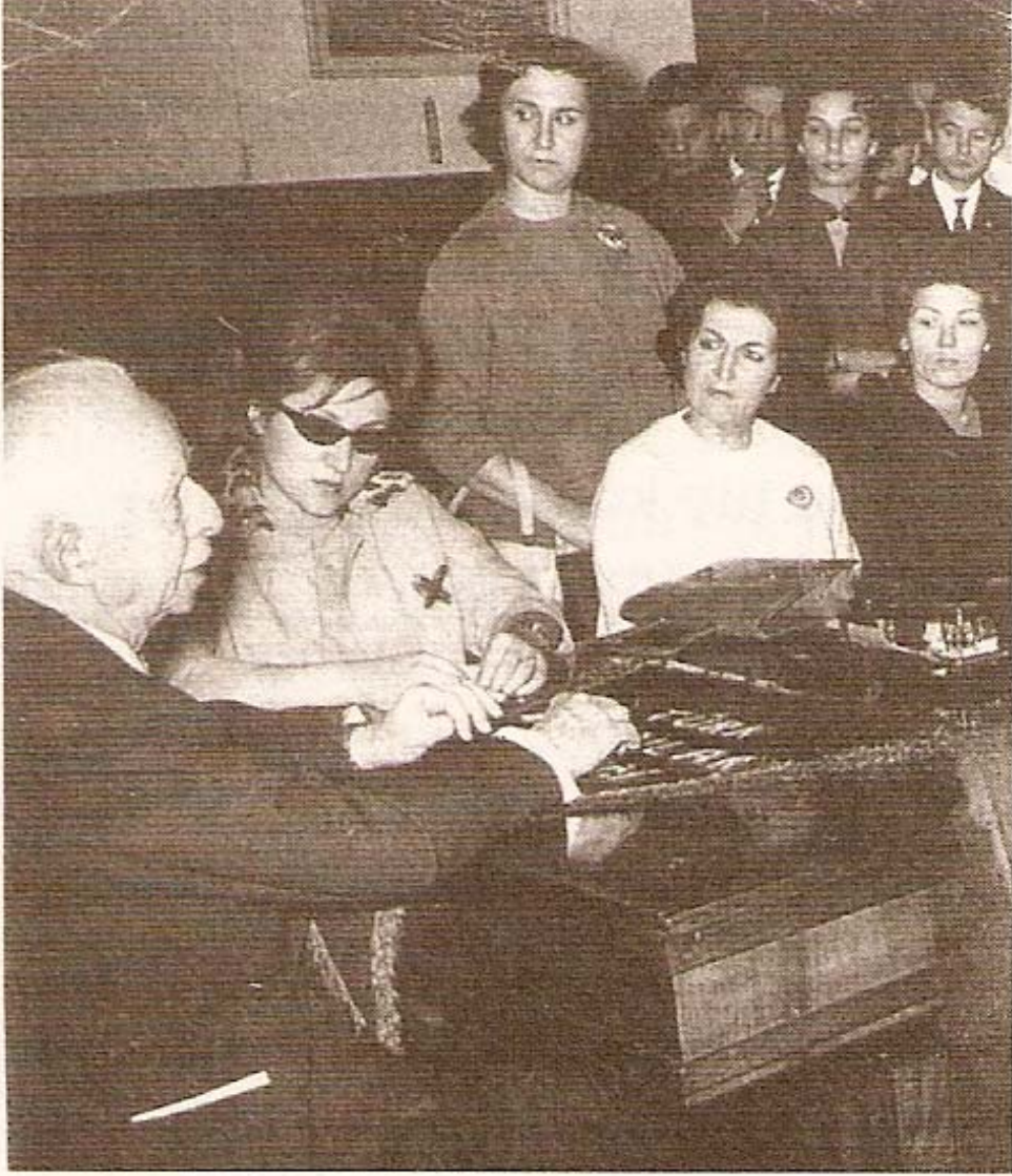
Kadın haklarıyla ilgili teklifleri İsmet Paşa'ya sunarken.