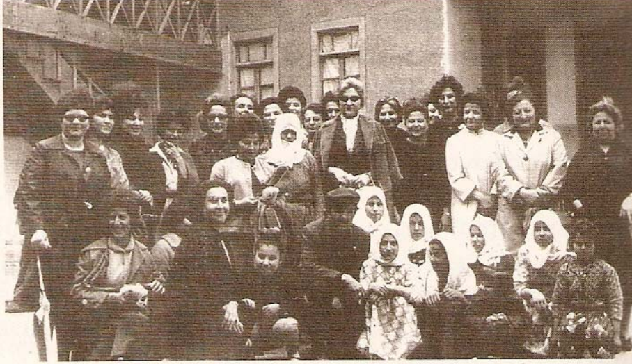
Köylü kadınlarla toplantı.