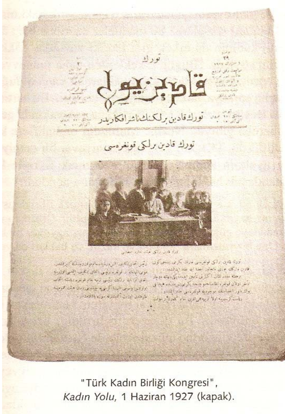
"Türk Kadın Birliği Kongresi", Kadın Yolu, 1 Haziran 1927 (kapak).