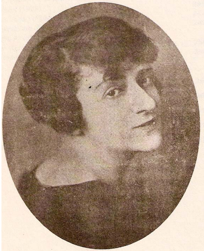
Nezihe Muhiddin, Kadın Yolu , 1 Haziran 1927.