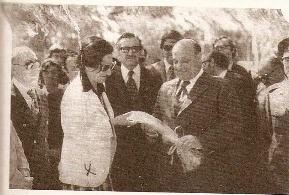
Kıbrıs'ta Rauf Denktaş ile Zübeyde Ana büstünün açılışında.