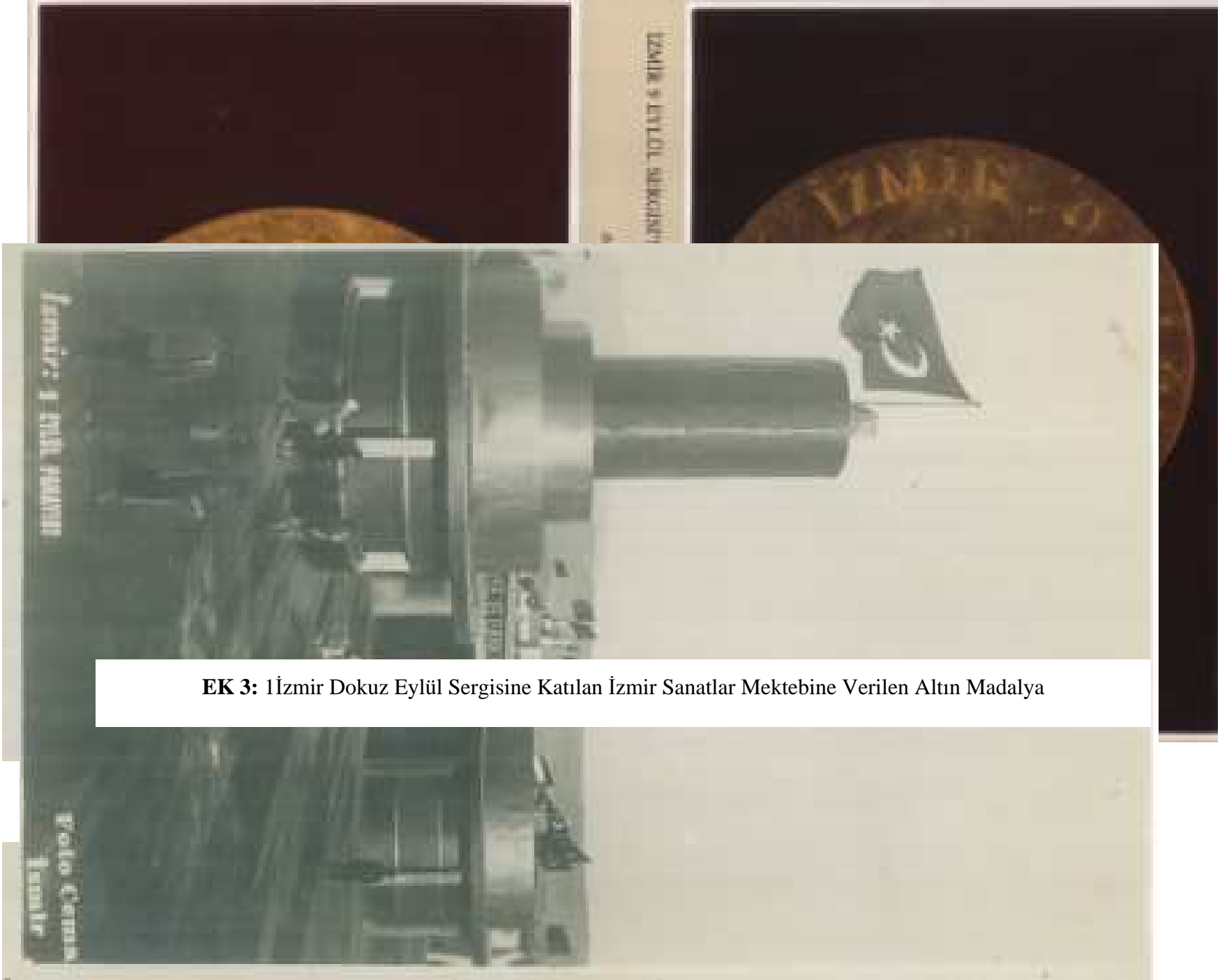
EK 3: İzmir Dokuz Eylül Sergisine Katılan İzmir Sanatlar Mektebine Verilen Altın Madalya