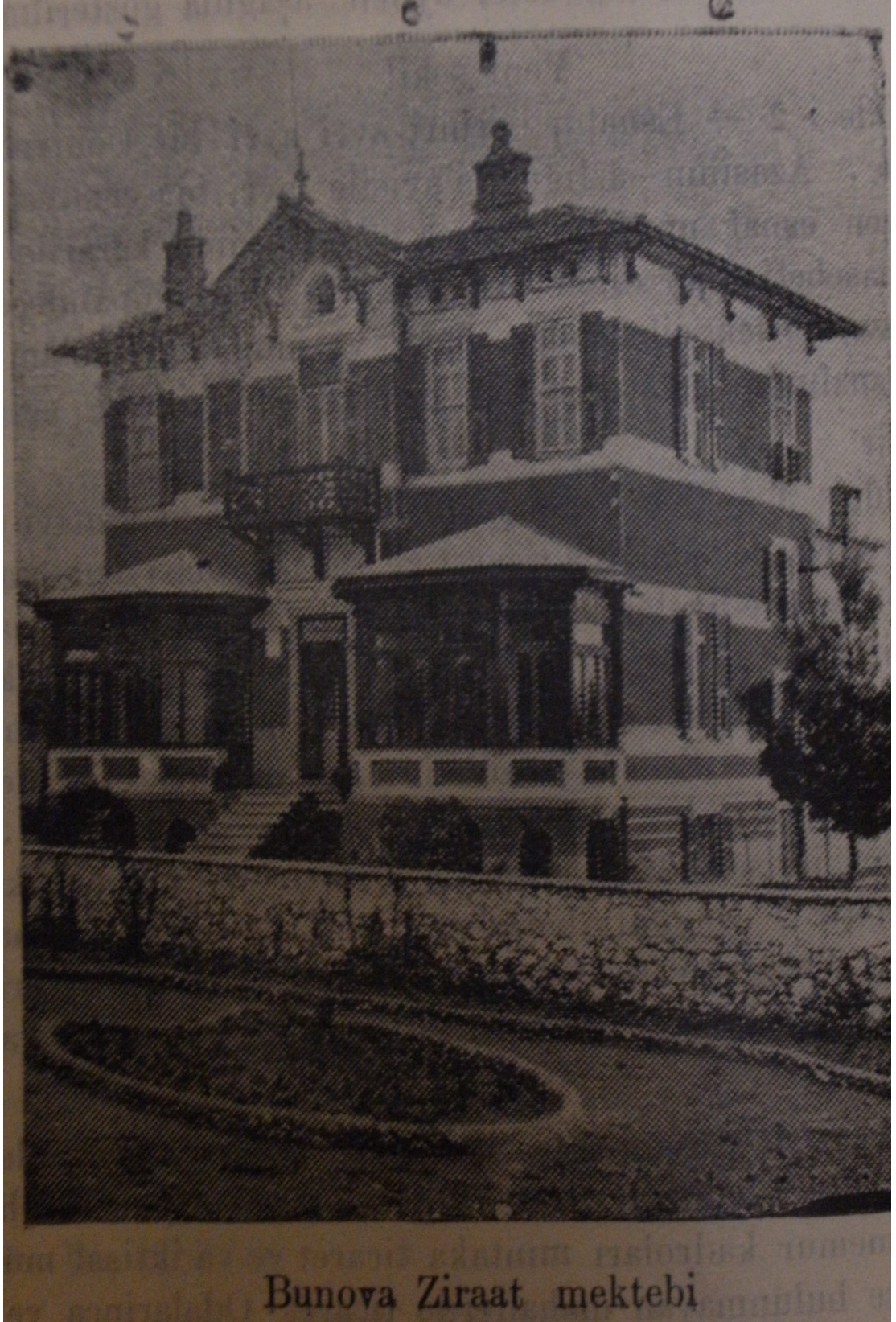
EK 13: Bornova Ziraat Mektebi

Kaynak: M. Ziya Lütfi, İzmir Mıntıkası Ticaret ve İktisadiyatı Sene 1929, s.206