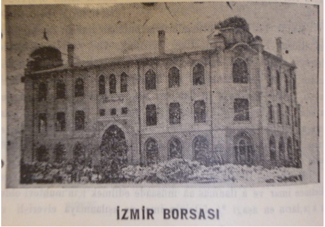
EK 15: İzmir Borsası