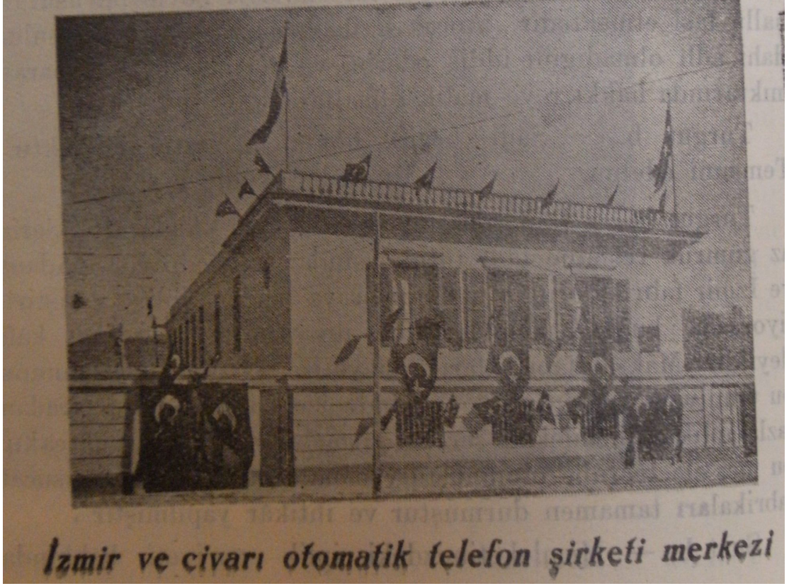
EK 9: İzmir ve Civarı Otomatik Telefon Şirketi Merkezi