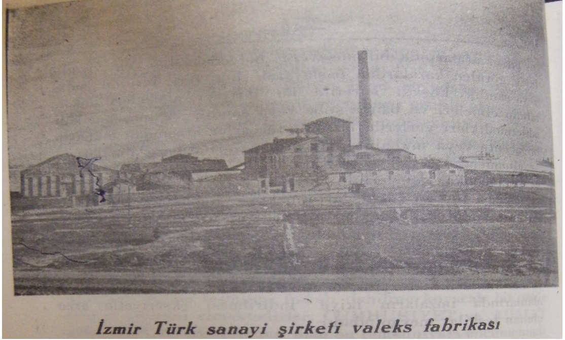
EK 10: İzmir Türk Sanayi Şirketi Valeks Fabrikası