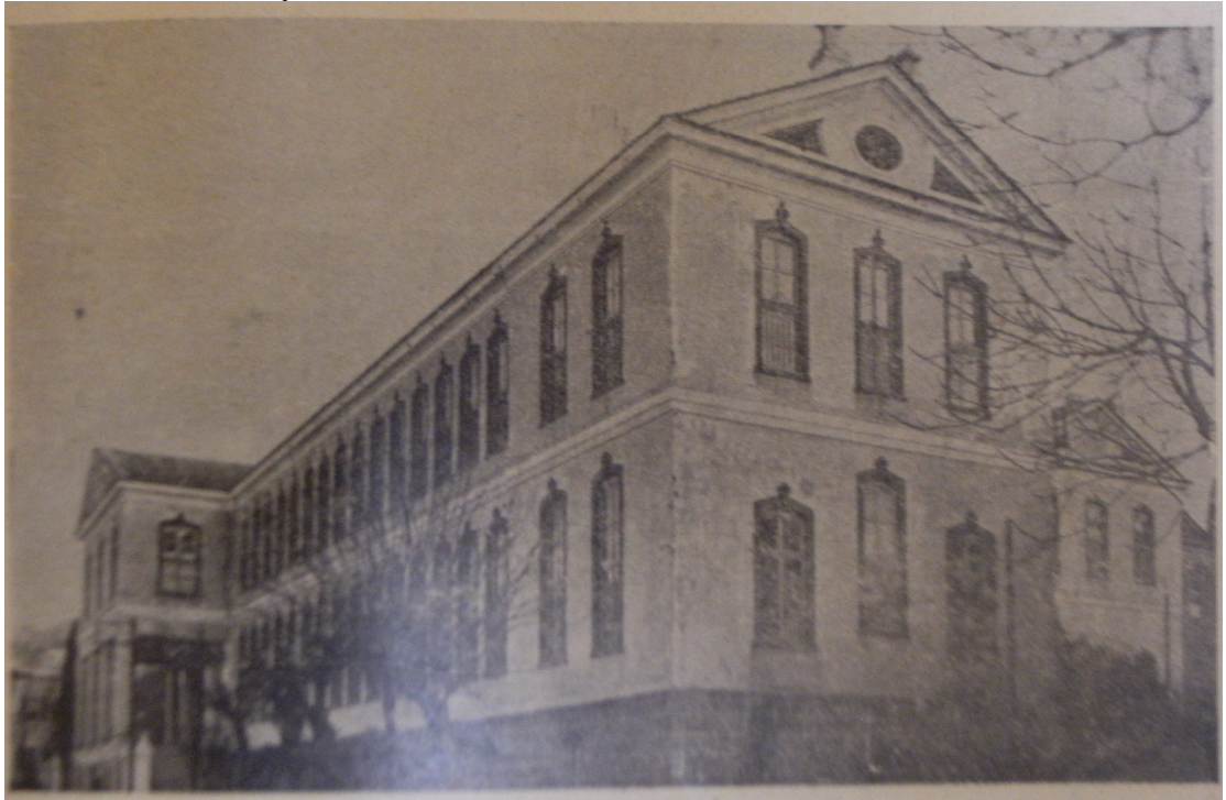
EK 18: Emrazı Sariye Hastanesi