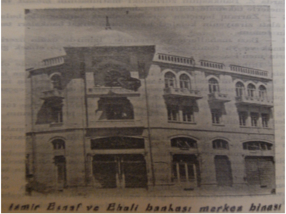
EK 11: İzmir Esnaf ve Ahali Bankası Merkez Binası

Kaynak: M. Ziya Lütfi, İzmir Mıntıkası Ticaret ve İktisadiyatı Sene 1929, s.120.