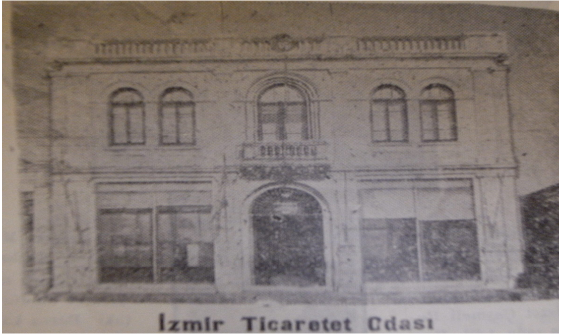
EK 16: İzmir Ticaret Odası

Kaynak: M. Ziya Lütfi, İzmir Mıntıkası Ticaret ve İktisadiyatı Sene 1929, Kısım 3, s.10.