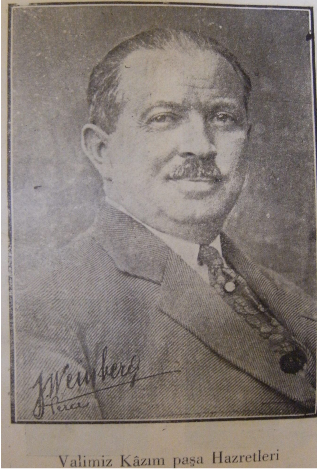
EK 1: İzmir'in Meşhur Valisi Kazım Paşa

Kaynak: İzmir Vilayeti Salnamesi 1928-1929, s. 199. ( Ekler Bölümü)