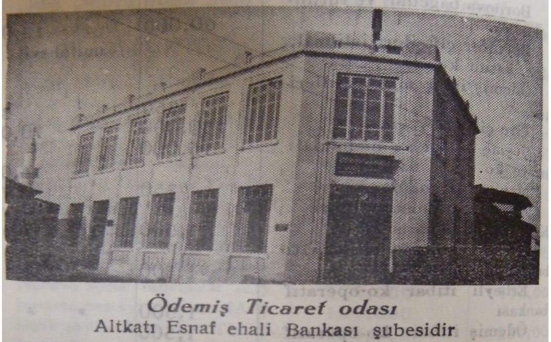
EK 12: Ödemiş Ticaret Odası