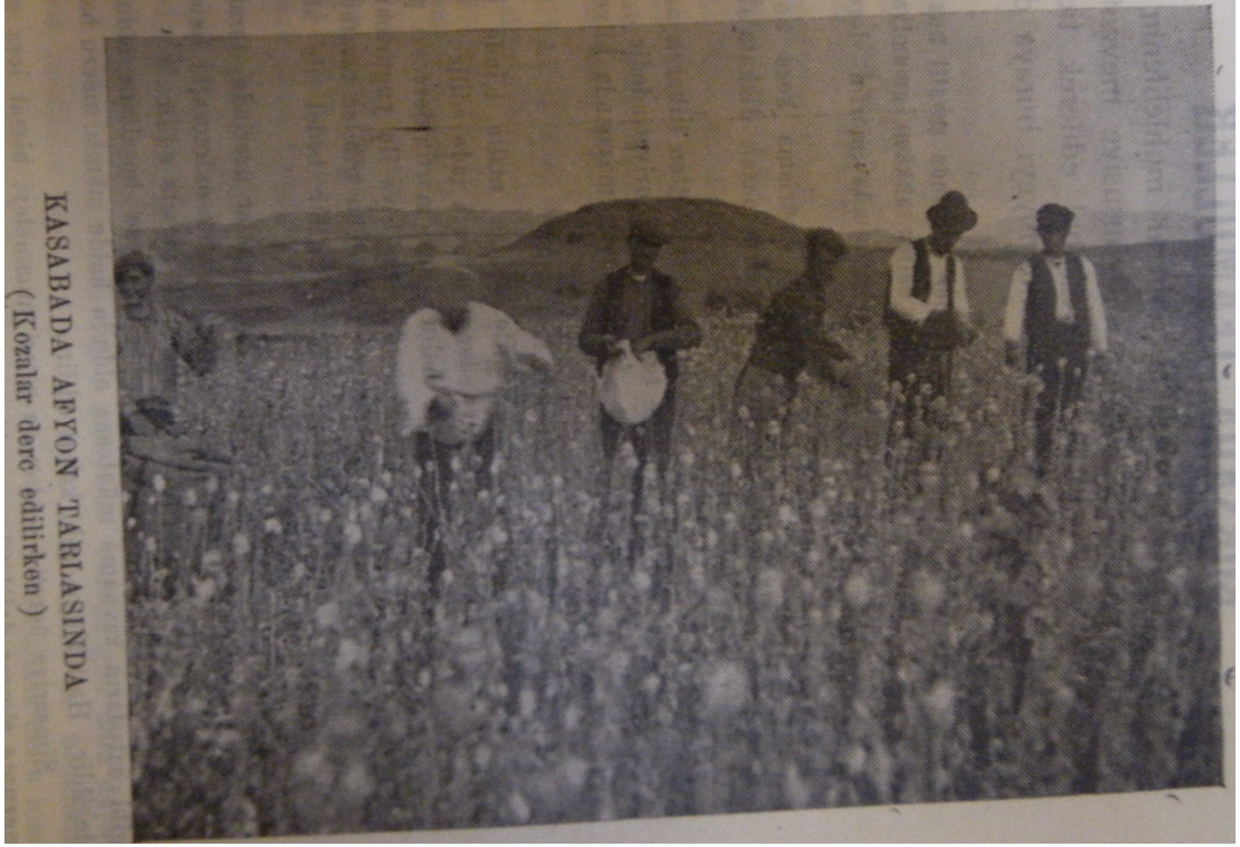
EK 17: Afyon Tarlasında Çalışanlar