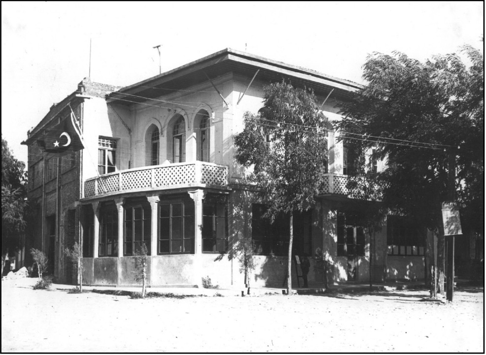
Aydın Halkevi Binası 1930'lu yılların sonları.

Halkevinin açılış merasimi nedeniyle Aydın mebusu Adnan Bey bir konuşma yapmıştır. Adnan (Menderes) Bey'in Halkevi açılış konuşması şöyleydi.