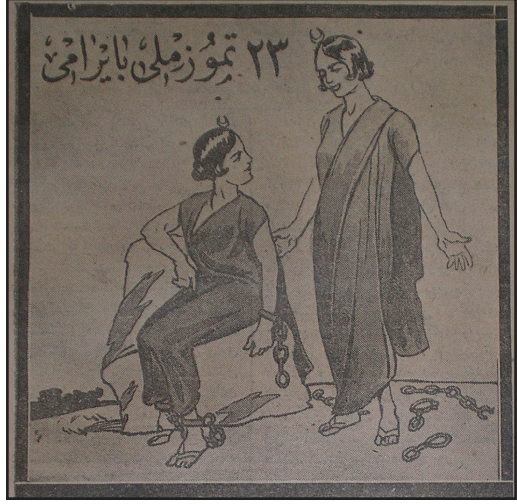
Cumhuriyet, 23 Temmuz 1925

Bu anlamlı günün her yıl kutlanması gerektiğini düşünen bazı Mebusan Meclisi üyelerinin sundukları önerge sayesinde 10 Temmuz (Miladi: 23 Temmuz 1908) günü ulusal bayram olarak kabul edildi ve her yıl resmi makamlar ve halk tarafından coşkulu bir şekilde kutlanmaya başlandı. Meşrutiyet gibi önemli bir kavramın halk nezdinde anlamını bulması ve yerleşmesi bakımından büyük önem taşıyan Hürriyet Bayramı, Cumhuriyet'in ilanından sonra da kutlanmaya devam etti. I. Dünya Savaşı'nın patlak vermesiyle Ulusal bayram kutlamalarındaki coşku daha da arttı. Benzeri örnekleri bugün bile karşımıza çıkmaktadır. Ulus olma bilincinin sınındığı bu vb. günler halkın bir arada olduğunun, düşman olarak görülen devlet, toplum veya topluluklara karşı bir bütün haline geldiğinin gösterilmesi bakımından önemli bir simgedir. Bayramlar, Savaşın en zor dönemlerinde bir bakıma halka moral destek vermektedirler. Bu anlamda ulusal bayramlar, ulus-devlet kavramının pekiştirildiği ve tam da anlamını bulduğu; devlet ve halk kitlelerinin bütünleştiği zamanlardır. Osmanlı dünyasında da, ülke emperyalist güçlere karşı savaşırken halkın buna karşı tepkisi ve desteği sanılandan daha önemliydi. Her ne kadar Hürriyet Bayramı kutlamalarının sönük geçtiği düşünülse de 2 ülkenin önemli merkezlerinde kutlamalar devam etmiş, meydanlarda ateşli konuşmalar yapılarak her fırsatta ordunun yanında bulunduğu dile getirilmiştir 3 .