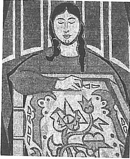
R.4 Nurullah Berk, “Gergef İşleyen Kadın” ,1974, 70x69.5 Cm. Tuval Üzerine Yağlıboya

En başarılı çalışmaları 1960 sonrası yaptıklarıdır. Bu resimlerde oturmuş bir biçim göze çarpar.Minyatürlerle ve hatlarla kurduğu ilişki ona özgün bir kimlik sağlar.Dekoratif öğelerin çok kullanıldığı bu çalışmalarda en çarpıcı yan figürlerdeki ifade değişkenliğidir. Figüratif bir resmi inatla sürdürmesine karşın , figürler iki tip anlatım içinde sergilenirler. Yüzlerde, minyatüre benzeyen tiplerin yanında kollar ve ellerde kübist bir yapı gözlenir.Renkler konturların arasında düz yüzeyler oluşturur.Minyatürlerle Kübizm arasındaki ikilem açıkça izlenir.(R.4)