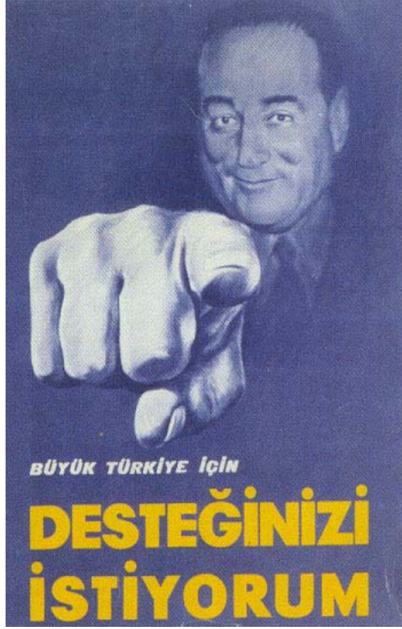
D.P. 'nin 1954 yılına ait bir seçim afişi

1954 seçimleri Demokrat Parti açısından çok büyük bir zafer olmuştur. Oyların %56.7'sini alan Demokrat Parti Meclise 541 milletvekilinden 508'ini sokmayı başarmıştır. Yeni kabinede yedi tane milletvekili bulunmakla beraber yedi milletvekili eski yerlerini muhafaza etmişlerdir. Kabinede bir devlet bakanlığı daha ihdas olmuş, bu durumda devlet bakanlığı sayısı üçe çıkmıştır. Yeni kabinenin tam listesi şu şekildedir;