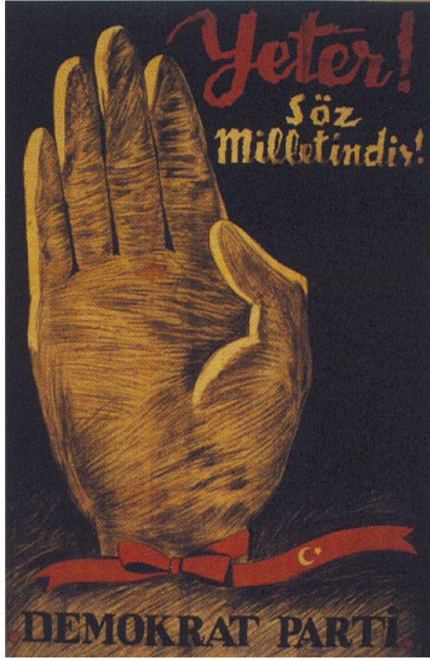
D.P.'nin 1946 ve 1950 seçimlerinde kullandığı ünlü afiş

9.5.1950 tarihinde Demokrat Parti seçim beyannamesini basına verdi. Beyanname daha çok mevcut iktidarın yaptığı yanlış politikalarla ilgili idi. Bunlara ilaveten C.H.P.'nin demokrasi taraftarı olmasına rağmen neden bunca sene iktidarı elinden bırakmak istemediği de eleştiriler arasındaydı. Halk partisi bugüne kadar mali ve siyasi politikalarında bir değişiklik yapmadı, yapmadığı gibi muhalefeti de susturmaya çalıştığı yönünde de eleştiriler vardı 94 .