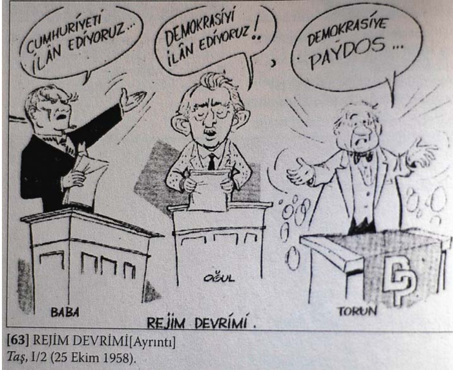
[63] REJİM DEVRİMİ[Ayrıntı] Taş, 1/2 (25 Ekim 1958).

Hükümet programı 23 Mayıs 1954 tarihinde Meclise sunuldu. Menderes verdiği izahatta taraf tutan devlet memurları meselesinin mutlaka halli gerektiğini söyledi 424 .