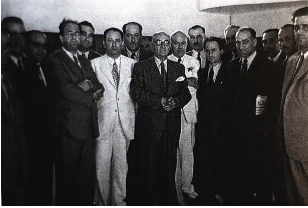
Celal Bayar D.P. Meclis Grubu Heyeti ile...