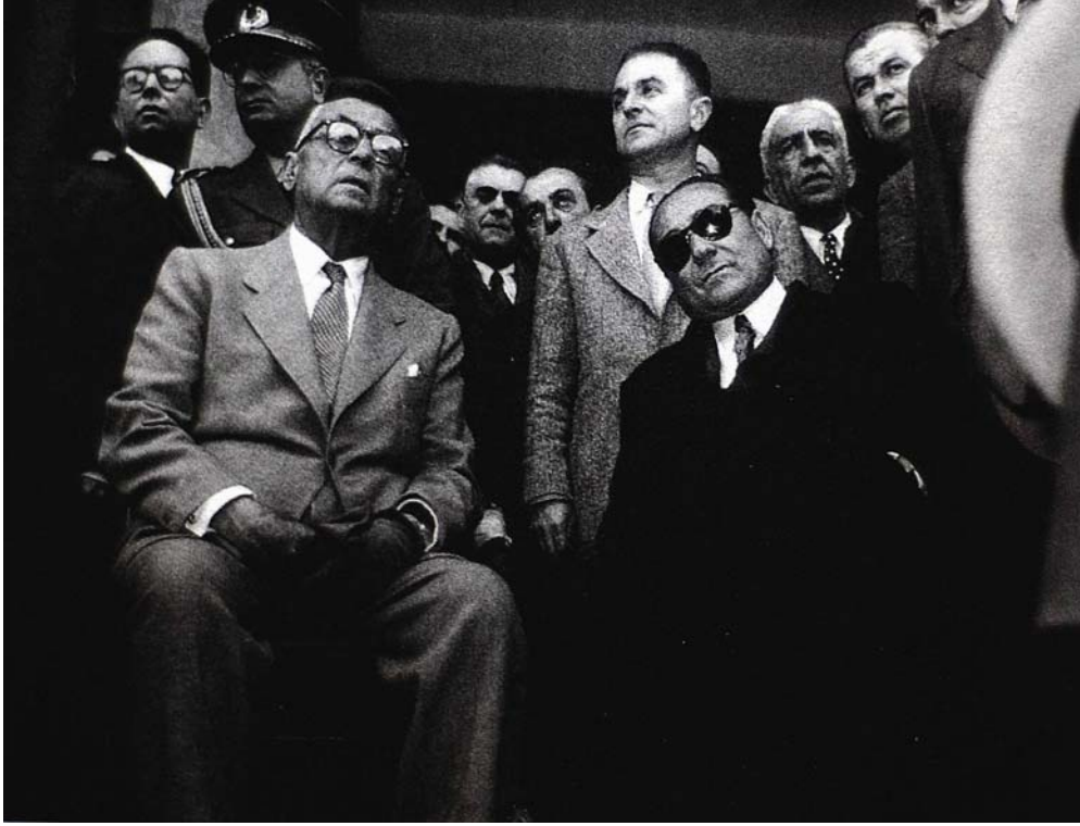
D.P.'ye egemen iki isim: Bayar ve Menderes (1957)

Menderes 1955 yılında gerek iç politikada gerek dış politikada oldukça hızlı bir yıl geçirmişti. Özellikle parti içinde yaşanan büyük buhran onu hayli yıpratmış fakat O'nu daha güçlü kılmıştı. Bu nedenle ilerleyen senelerde şiddeti gittikçe artan bir tasfiye hareketine girişmişti.