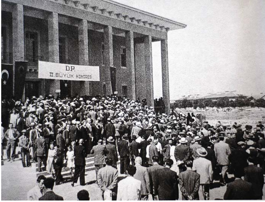
D.P. İkinci Büyük Kongresi (1949)

Kongre başkanlığına kimin seçileceği ile ilgili olarak adı geçen kişiler arasında Ekrem Hayri Üstündağ'ın ismi ilk sırada yer alıyordu. İkinci başkanlığa aday isimler arasında ise Sıtkı Yırcalı, Hulusi Köymen ve bazı çevrelere göre Ethem Menderes vardı. Delege merkezlerinde ise fikir ayrılıklarının önceden belirgin olması Merkez Kurulu seçiminin hayli çekişmeli olacağını göstermekteydi. İdare kurulunu teşkil eden üyeler arasında net bir fikir olarak yalnızca Celal Bayar'ın ismi geçmekteydi 178 .