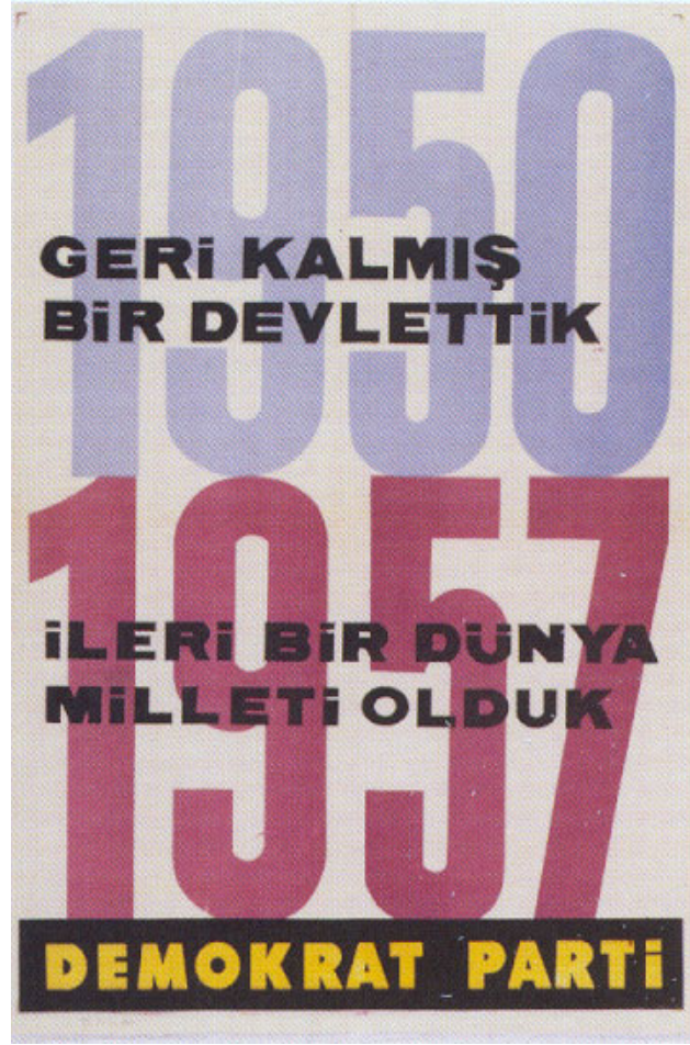
Demokrat Parti'nin 1957 seçim afişlerinden biri

Menderes birçok yerel örgütün kongre yapmasına güvenmediği gibi aday listelerinin hazırlanmasına da güvenmiyordu. Bu nedenle bazı illerde aday listelerinin hazırlanmasını yasaklamıştı. Toplam on beş il örgütünden aday göstertmeyecekti. Bu nedenle, buradaki adayları kendi belirlemişti. Bunlar; İzmir, Manisa, Burdur, Zonguldak, Kırşehir, Gaziantep, Adıyaman, Diyarbakır Elazığ, Erzurum, Ankara, Çankırı, Kars ve Van'dı 146 .