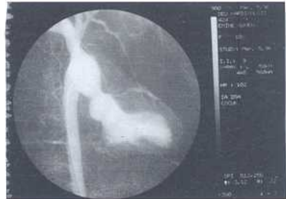
Şekil 3. Olgunun supravavüler aort darlığının anjiyografik görünümü.

Kardiyovasküler sistem muayenesinde, palpasyonla suprasternal çentikte boyuna yayılan sistolik thrill, oskültasyonda sağ 2.İKA 3/6° sistolik ejeksiyon üfürümü vardı. Telekardiyografide kardiyotoraksik oran normal, sol ventrikül konturu belirgin, asendan aorta geniş olarak saptandı. Akciğer vaskülaritesi normaldi. Elektrokardiyografide sol ventrikül hipertrofisi ve sistolik yüklenme bulguları vardı. Ekokardiyografik çalışmada interatrial ve interventriküler septum intakt, mitral kapakta mitral valv prolapsusu ve 1° yetersizlik, aort kapağının 1 cm kadar üstünde, çıkan aortada 55 mmHg basınç gradienti oluşturan diskret darlık saptandı. Kateter ve anjiyografik çalışmada supravavüler, kum saati şeklinde aort darlığı, persistan foramen ovale ve sol sinüs valsavadan tek koroner arter çıkışı saptandı (Şekil 3, 4). Göğüs Kalp Cerrahisi kliniğinde ameliyatı yapılarak kardiyak patolojileri düzeltildi.