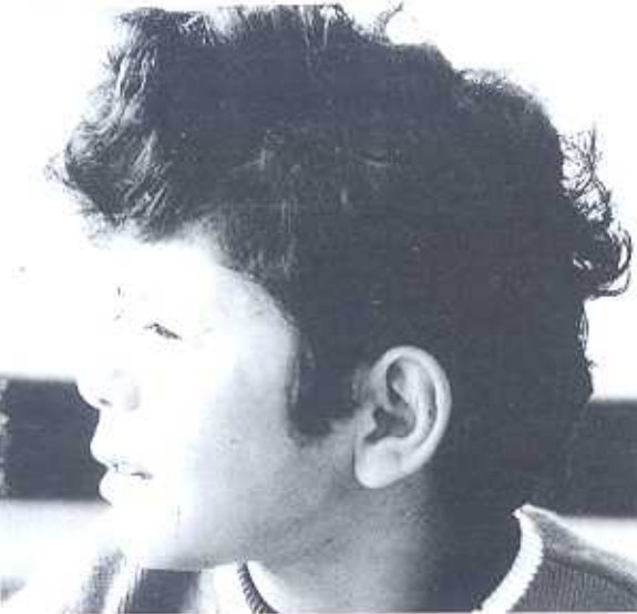
Şekil 2. Olgunun yandan yüz görünümü.

Kardiyovasküler sistem muayenesinde, palpasyonla suprasternal çentikte boyuna yayılan sistolik thrill, oskültasyonda sağ 2.İKA 3/6° sistolik ejeksiyon üfürümü vardı. Telekardiyografide kardiyotoraksik oran normal, sol ventrikül konturu belirgin, asendan aorta geniş olarak saptandı. Akciğer vaskülaritesi normaldi. Elektrokardiyografide sol ventrikül hipertrofisi ve sistolik yüklenme bulguları vardı. Ekokardiyografik çalışmada interatrial ve interventriküler septum intakt, mitral kapakta mitral valv prolapsusu ve 1° yetersizlik, aort kapağının 1 cm kadar üstünde, çıkan aortada 55 mmHg basınç gradienti oluşturan diskret darlık saptandı. Kateter ve anjiyografik çalışmada supravavüler, kum saati şeklinde aort darlığı, persistan foramen ovale ve sol sinüs valsavadan tek koroner arter çıkışı saptandı (Şekil 3, 4). Göğüs Kalp Cerrahisi kliniğinde ameliyatı yapılarak kardiyak patolojileri düzeltildi.