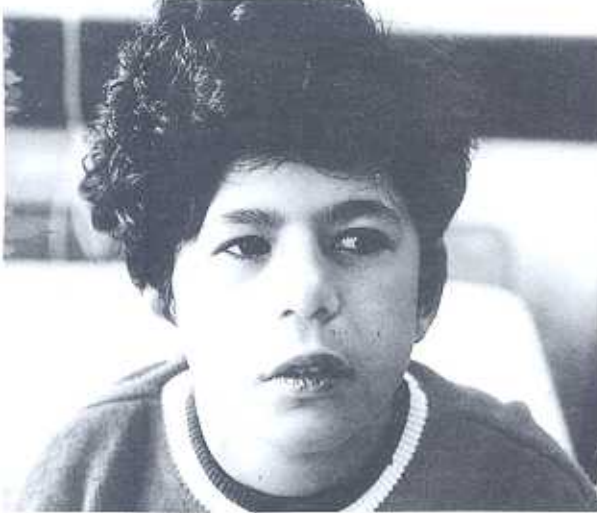
Şekil 1. Olgunun önden yüz görünümü.

boy:135 cm (%25), kalp tepe atımı 88/dk, ritmik, KB:120/80mmHg, solunum:16/dk, femoral nabazanlar iki taraflı palpe ediliyordu. Psikolojik testlerde öforik kişilikli, IQ'sünün 75 olduğu saptandı. Baş-boyun muayenesinde yüz görünümü geniş ve öne çıkıntılı alın, epikantal kıvrım, gelişmemiş burun kökü ve üst çene, geniş ağız, yukarı çekik ve uzun üst dudaklar ve burun, hipotelorizm ve diş malformasyonları saptandı (Şekil 1,2).