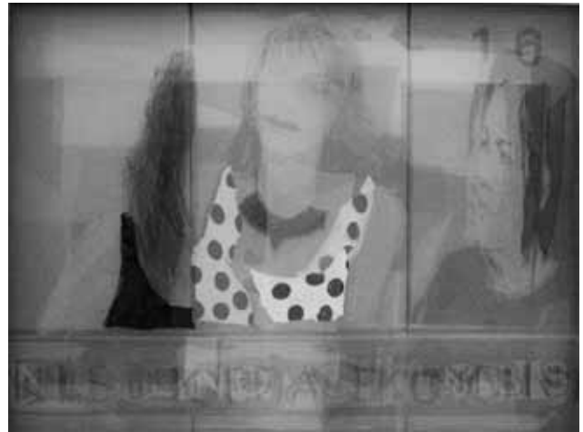
Resim 2. İrfan Önürmen, Pentül II serisinden, 2009, Tuval Üzerine Karışık Teknik, 47x65 cm.

Bir örümcek ağı gibi tuvaleri saran, üst üste örülen tüller ve yapılan eklemeler, daha önce de belirtildiği gibi sanki toplumsal yapıda meydana gelen çatlakları kapatma girişimi gibidir. Resimlerde kullanılan malzemenin sunum biçimi, odağı malzemeye kaydırmakta bu yüzden çatlaklar arasından sızan görüntüleri göz her seferinde farklı açılardan yakalamaktadır. Çok katmanlı yüzeyden izleyene ulaşan görüntülere, saklı düzenden dış dünyaya sızan yapay gerçeklik göndermeleri de denilebilir. Başka bir deyişle de, dış dünya gerçeğinden süzülen, dönüştürülen medya gerçekliklerinin (aslında defolu gerçeklikler de denilebilecek yapaylığın) bir de tülle maskelenmesi, perdelenmesi eylemi-