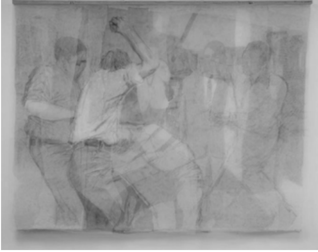
Resim 3. İrfan Önürmen, Dayak , Tül Kompozisyonlar I serisinden, 2002, Tül Üzerine Karışık Teknik, 150x200 cm.

dir. Aynı medyanın da yaptığı gibi; acı, tuhaf, coşkulu ya da şiddeti içeren görüntülerin masumlaştırılarak sunumu dikkate değerdir. Resim 3'te medyadan seçilmiş şiddet anının yine tül malzemesi ile sorgulandığı görülmektedir. Medyada her gün karşılaşılan bu tür imgelerin sınırsız sayıda dolaşımının yarattığı sıradanlaştırma, içeriğinin boşaltılma girişimi, bu resimde bir de tül malzemesinin ardına gizlenerek etkisi, acısı bir kat daha perdelenerek masumlaştırılmıştır.