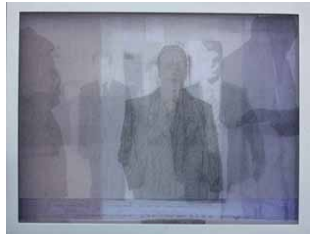
Resim 4. İrfan Önürmen, Pentül II serisinden, 2009, Tuval Üzerine Karışık Teknik, 47x60 cm.

Yaşanmış anların birikiminden yola çıkan sanatçı, bir yandan da imgeyi silsileler halinde tüketen çağımız görsel kültürünün alışkanlıklarına eleştirel bir mesafeden bakabilmemize olanak tanıyor... Gerçekle kurgu iç içe. Televizyonun sersemletici akışını çağrıştıran bu parçalı imgeler bombardımanı, her şeyin silikleştiği, kendi olmaktan çıktığı, gerçekten kurguya kurgudan gerçeğe dönüştüğü, grileştiği bir alana göndermede bulunuyor.