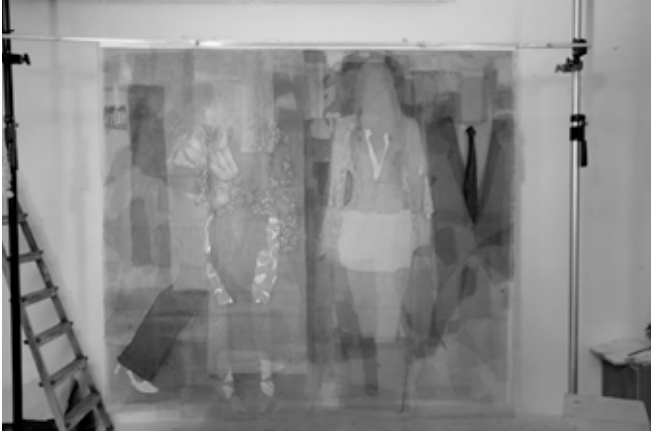
Resim 1. İrfan Önürmen, Tül Kompozisyonlar II serisinden, 2008, Tül Üzerine Karışık Teknik, 185x210x15 cm.

Günümüz sanatına farklı bir soluk getiren İrfan Önürmen, yapıtlarında kültürel ve toplumsal değişimi-başkalaşımı eleştirel boyutta sorgulamakta ve bu değişim-başkalaşımı yapıtlarının teknik boyutuyla daha çarpıcı kılmaktadır. Sanatçının gündelik yaşam görüntülerini kurcalayan, arala-