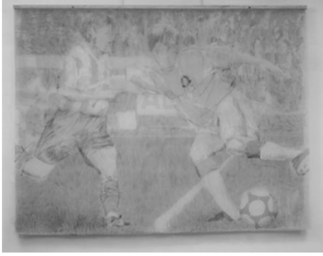
Resim 6. İrfan Önürmen, Futbol , Tül Üzerine Karışık Teknik, 2002, 175x200 cm.