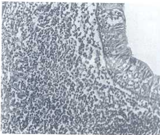
Şekil 2. Skuamoz epitel ile döşeli kistik yapı ve bu yapı çevresinde mononükleer hücre toplulukları

Olgu 2: 57 yaşında erkek hasta, inşaat malzemeleri satan olgu zaman zaman bu malzemelerden aspire ettiğini belirtiyor. 1,5 yıl süren ses kısıklığı, horlama yakınmaları nedeniyle Kulak Burun Boğaz Hastalıkları Polikliniğine başvuran hastaya yapılan direkt laringoskopik incelemede sol ön kommissürde yumuşak kıvamda lezyon görülmüş ve ekstirpe edilmiştir. D.E.Ü.T.F Patoloji Anabilim Dalında (6349/91) protokol numarası